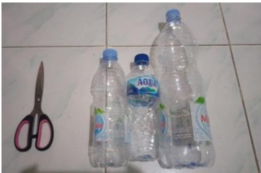
Gambar 2 , Gunting dan botol plastik bekas

Bahan-bahan yang digunakan dalam kegiatan ini adalah gunting, botol plastik air kemasan (Gambar 2), berbagai jenis sampah plastik (Gambar 3), dan stik pematik (gambar 4).