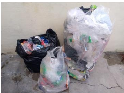
Gambar 3 . Berbagai jenis sampah plastik