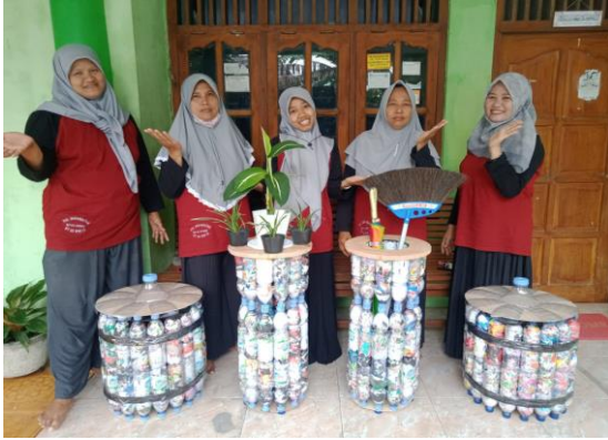
Gambar 7. Tempat serbaguna