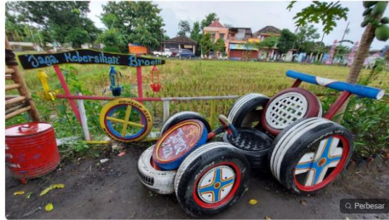
Gambar 1. Salah satu lokasi wisata di Desa Ngrombo

Lokasi desa wisata ini berhasil menarik pengunjung dari berbagai kota. Diperkirakan pada setiap akhir pekan, terdapat 1000 wisatawan yang memadatnya. Adanya industri kreatif gitar dan banyaknya wisatawan yang berkunjung selain memberikan dampak dari sisi finansial, juga berdampak pada limbah industri maupun sampah lain yang dihasilkan. Jenis limbah industri yang dihasilkan berupa logam bekas, ban bekas, dan sisa potongan kayu dan triplek. Sedangkan berbagai jenis sampah yang dihasilkan antara lain sampah organik sisa makanan serta sampah plastik.