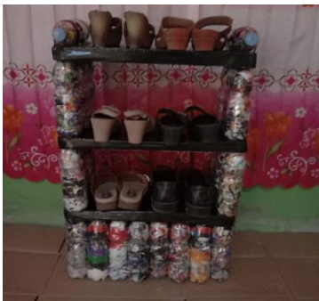
Gambar 9. Rak sepatu