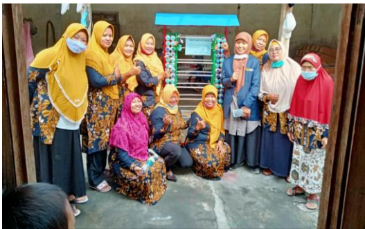
Gambar 8. Rak multifungsi