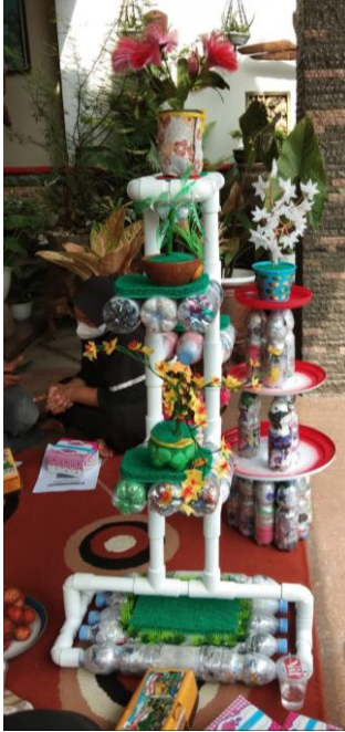
Gambar 10. Rak tanaman hias

Pemahaman, pengetahuan dan perilaku warga mitra merupakan modal yang dapat digunakan untuk berinovasi dan berkreaitivitas dalam menyikapi permasalahan. Hal ini tidak dapat berjalan tanpa adanya kerjasama antara pemerintahan desa dengan masyarakat. Hal ini sejalan dengan yang disampaikan oleh (Swesti, W; Soeprihanto, 2020) bahwa pengembangan desa wisata kreatif memerlukan integrasi yang bagus antara pemerintahan dengan pihak lain, termasuk masyarakat dan akademisi. Dalam kegiatan ini, masyarakat merupakan pelaku utama untuk mengembangkan ecobrick. Namun, masyarakat tidak dapat bergerak leluasa juga tanpa dukungan dari pemerintah desa. Bentuk dukungan ini antara lain berupa prospek penawaran dan penjualan produk ecobrick saat kunjungan wisata di desa tersebut.