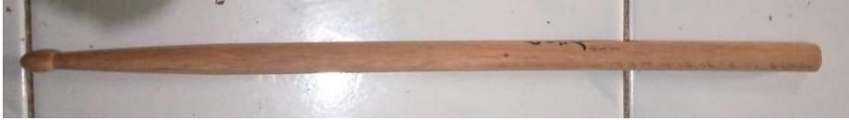
Gambar 4. Stik pematik