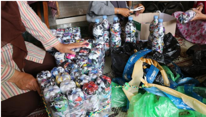
Gambar 11. Kegiatan memotong sampah plastik, memadatkannya di dalam botol, dan terbentuk ecobrick