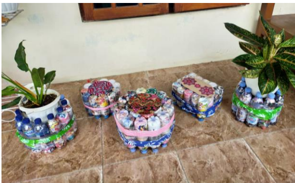
Gambar 6. Meja Kursi