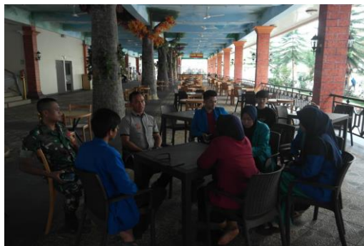
Gambar 6. Kegiatan Wawancara dengan Pengelola Grand Waterboom

Destinasi selanjutnya yang dikunjungi adalah Grand Waterboom, dimana Grand Waterboom ini menjadi tempat wisata yang besar di Kabupaten Maros. Berdasarkan hasil observasi dan wawancara disana tidak hanya terdapat tempat pemandian saja namun juga terdapat area wahana permainan, area pemancingan, penginapan, serta penyewaan ballroom . Grand Waterboom ini berdekatan dengan Grand Mall dan Grand Hotel yang juga terkenal di kabupaten Maros, Grand Waterboom ini juga mengangkat konsep klasik romawi pada desain-desain tempatnya baik di dalam ruangan maupun di luar ruangan. Kegiatan wawancara dengan pengelola Grand Waterboom dapat dilihat pada Gambar 6 .