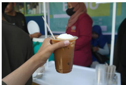
Gambar 4. Visualisasi inovasi Sarabba Cika

Tidak hanya membantu dalam pembuatan Nutrition Facts , namun pemilik UMKM ini juga diberikan ilmu mengenai pembuatan Nutrition Facts berdasarkan ketentuan yang telah ditetapkan BPOM. Selain itu juga menurut pemilik usaha Sarabba Cika, minuman jahe instan ini akan dikembangkan menjadi minuman dingin, dan melalui program kegiatan ini juga diinovasikan dengan penambahan topping ice cream berbahan santan pada minumannya untuk menambahkan sensasi santan pada minuman sarabba. Disinilah perbedaan antara minuman sarabba konvensional yang dikenal oleh masyarakat Sulawesi dengan Sarabba Instan (Sarabba Cika) dimana pada Sarabba konvensional menggunakan tambahan santan murni, sedangkan pada Sarabba Cika menggunakan creamer . Oleh karena itu dengan adanya inovasi pembuatan ice cream pada minuman dingin Sarabba Cika diharapkan dapat menyempurnakan rasa dari minuman dingin sarabba cika. Produk inovasi ini di pamerkan pada kegiatan Expo KKN Mas yang dihadiri oleh seluruh kelompok KKN Mas di Kabupaten Maros dan perwakilan dosen dari berbagai Perguruan Tinggi Muhammadiyah. Hasil dari kegiatan Expo ini yaitu banyak pihak yang mengunjungi stand minuman dingin Sarabba Cika dan menyukai topping ice cream yang ditambahkan pada minuman dingin berbasis jahe ini. Visualisasi inovasi Sarabba Cika dapat dilihat pada Gambar 4 .