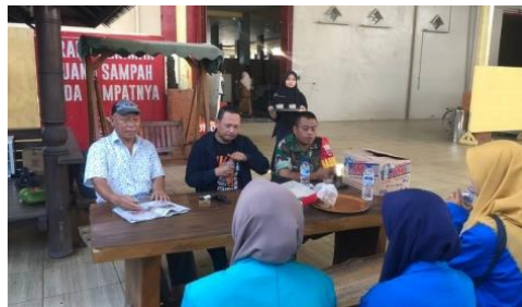
Gambar 2. Dokumentasi kegiatan diskusi dengan pemilik usaha Zazil Bakery

Pada kunjungan ke Zazil Bakery, kegiatan yang dilakukan adalah bertemu langsung dengan pemilik usaha untuk melakukan wawancara dan FGD serta melihat proses produksi Zazil Bakery. Proses wawancara berkaitan dengan perjalanan produksi Zazil Bakery dan hambatan-hambatan dalam perkembangannya. Setelah melihat seluruh proses produksi dilanjutkan dengan berdiskusi dengan pemilik usaha terkait penerapan Higiene Sanitasi pekerja. Hasil dari diskusi tersebut pemilik usaha akan terus memperhatikan penerapan SOP pekerja terutama pekerja yang bersinggungan langsung dengan proses produksi dan kegiatan diskusi dengan pemilik usaha Zazil Bakery dapat dilihat pada Gambar 2