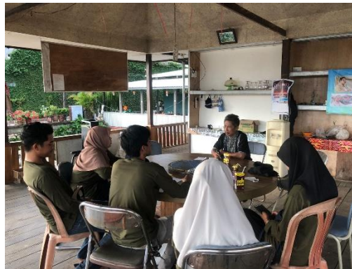
Gambar 5. Kegiatan FGD dengan pengelola Telaga Pemancingan Maccopa

Dari konsep-konsep pengembangan tempat wisata yang diajukan terdapat beberapa konsep yang diterima diantaranya yaitu terkait petunjuk arah, sosial media, kebersihan, penyewaan alat pancing, pembangunan musholla, dan renovasi gazebo. Kegiatan FGD yang dilaksanakan dapat dilihat pada Gambar 5 .