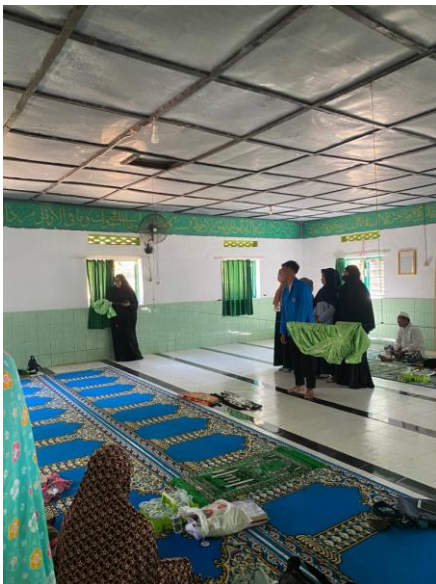
Gambar 8. Praktek sholat jenazah