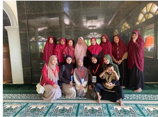
Gambar 7. Pengajian majlis talim