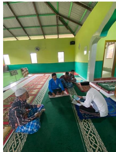
Gambar 9. Praktek sholat jumat