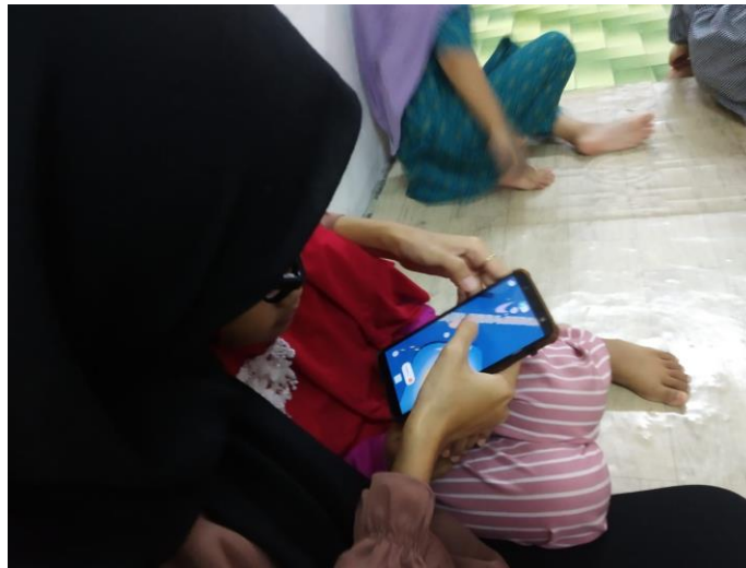
Gambar 5 Siswa SB IKABA IMABA 2 mencoba langsung aplikasi Assemblr Edu

Siswa kelompok C yang berusia 10-14 tahun mendapat kesempatan untuk mencoba aplikasi Assemblr Edu secara langsung seperti pada gambar 6. Beberapa siswa kelompok C bahkan membawa smartphone sendiri yang dibawa dari rumah untuk dipasangkan aplikasi AR tersebut. Sehingga siswa dapat melanjutkan pembelajaran di rumah dan dapat memaksimalkan kegunaan smartphone yang selama ini hanya digunakan untuk bermain game dan berkomunikasi dengan orang tua.