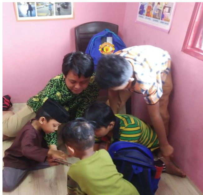
Gambar 5 Dosen Pendamping mengajak siswa mengenal alat musik tradisional melalui AR