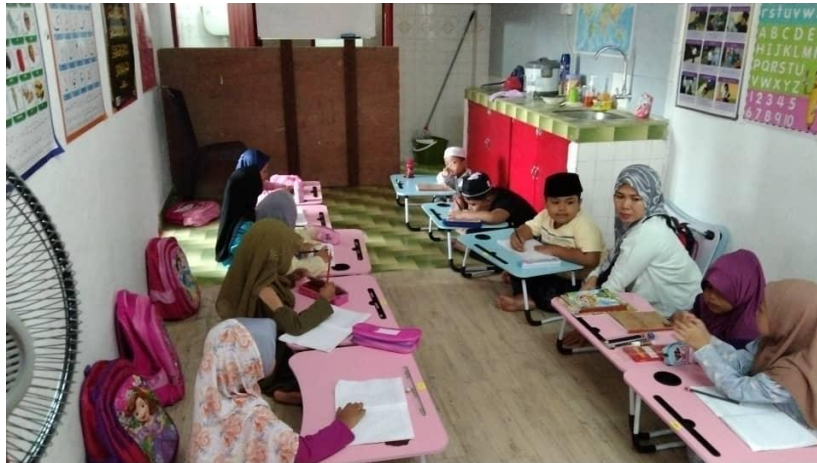
Gambar 1 Suasana Pembelajaran di SB IKABA IMABA

Seiring dengan perkembangan teknologi informasi khususnya dalam dunia Pendidikan, saat ini mulai banyak diterapkan teknologi Augmented Reality (AR) sebagai pelengkap media pembelajaran yang ada [5]. AR merupakan sebuah teknologi yang menggabungkan konten digital ke dalam dunia nyata melalui bantuan kamera [6]. Dengan penerapan teknologi AR ini maka kebutuhan alat-alat peraga yang diperlukan sekolah dapat diganti dengan model digital sehingga tingkat pemahaman siswa dapat meningkat. Sejalan dengan penelitian yang dilakukan oleh Monita [7] bahwa penggunaan AR dalam proses pembelajaran dapat meningkatkan minat dan motivasi dari peserta didik yang berdampak pada tingkat pemahaman.