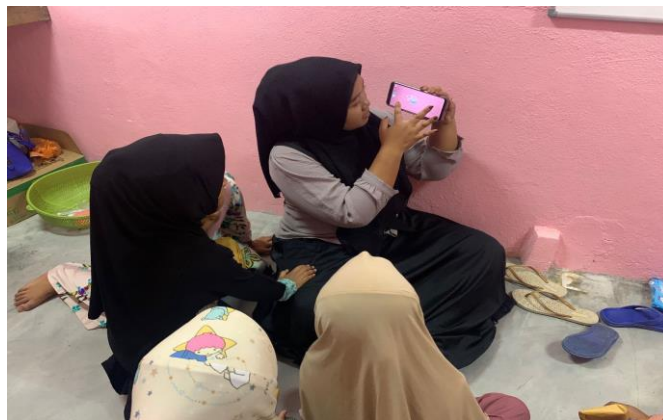
Gambar 4 Mahasiswa KKN Kemitraan Internasional memperagakan aplikasi AR kepada siswa

Siswa kelompok A dan B mendapatkan materi tentang pengenalan mata uang dan alat musik tradisional Indonesia seperti terlihat pada Gambar 4 dan 5. Dikarenakan keterbatasan perangkat smartphone maka Dosen pendamping dan mahasiswa KKN Kemitraan Internasional menggunakan smartphone yang dimiliki sebagai perangkat AR. Siswa diajak secara berkelompok 3-4 orang untuk melihat demonstrasi aplikasi AR