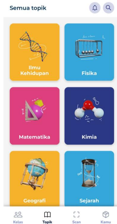
Gambar 2. Tampilan Materi Aplikasi Assemblr Edu

Materi yang diajarkan kepada kelompok A dan B terkait dengan dengan topik pengenalan mata uang dan alat musik tradisional Indonesia seperti terlihat pada gambar 3. Pemilihan materi didasari dari background siswa kelompok tersebut walaupun berstatus sebagai warga negara Indonesia namun belum pernah melihat uang dan alat musik tradisional karena sejak lahir sudah tinggal di Malaysia. Sedangkan untuk kelompok C dimana di kelompok ini siswa sudah bisa membaca dan menulis dengan lancar maka materi yang dipilih yaitu tentang sejarah dan pengetahuan umum.