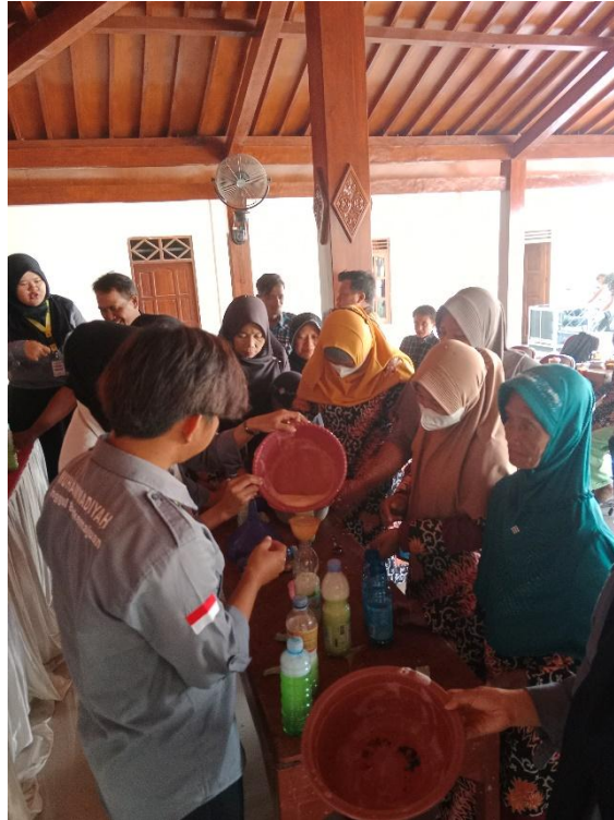
Gambar 2. Sabun pencuci piring hasil kegiatan pengabdian Masyarakat Bersama SHG Desa Puhgogor