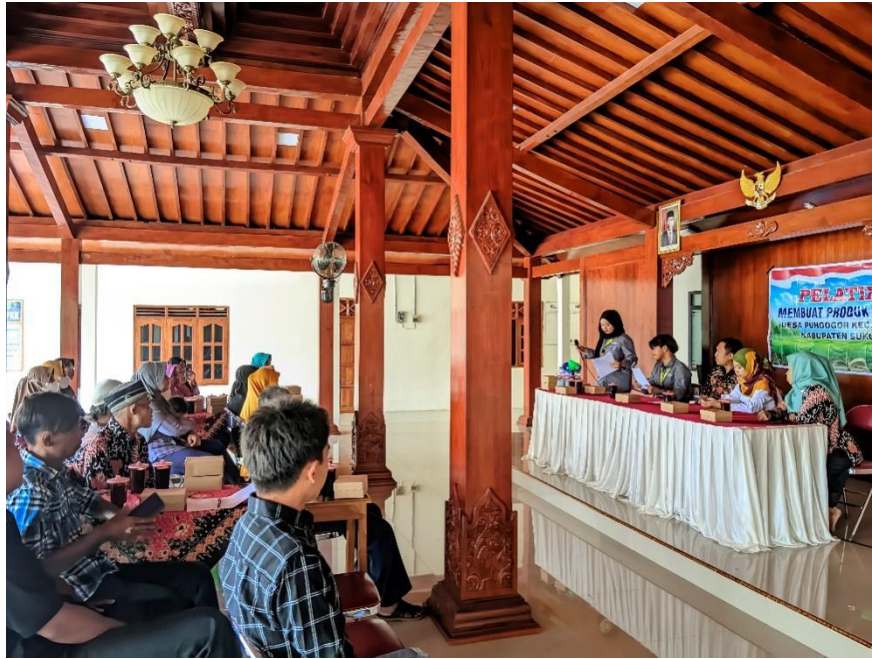
Gambar 1. Kegiatan Pelatihan pembuatan Sabun Pencuci Piring

menghasilkan sabun pencuci piring yang bisa dibawa pulang oleh masing-masing peserta pelatihan. Selain terampil membuat sabun pencuci piring juga dapat membawa produk yang mereka buat sendiri ketika kegiatan pelatihan. Sabun pencuci piring dipilih sebagai materi kegiatan karena digunakan dalam kehidupan sehari-hari.