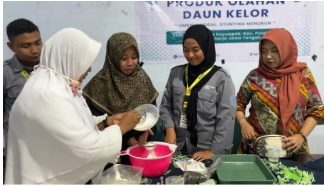
Gambar 4. Pengolahan dan Demonstrasi Produk Olahan Daun Kelor

Selain itu, kelompok 75 juga melakukan budidaya tanaman kelor dengan cara membagikan 1 rumah 1 pohon kelor. Pada Gambar 5 terlihat bekerja sama untuk menyiapkan bibit kelor yang akan dibagikan kepada warga RW 03 Desa Kayuapak.