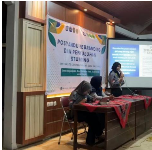
Gambar 2. Penyuluhan Stunting dan Manfaat Daun Kelor di Posyandu