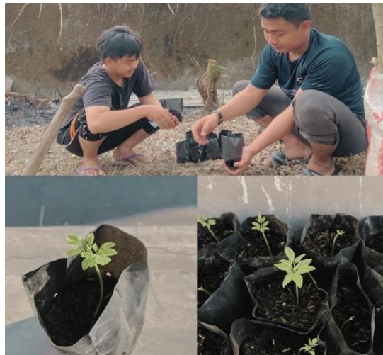
Gambar 5. Penanaman Daun Kelor

Selain itu, kelompok 75 juga melakukan budidaya tanaman kelor dengan cara membagikan 1 rumah 1 pohon kelor. Pada Gambar 5 terlihat bekerja sama untuk menyiapkan bibit kelor yang akan dibagikan kepada warga RW 03 Desa Kayuapak.