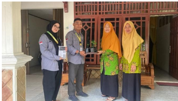
Gambar 6. Pembagian 1 Rumah 1 Pohon Kelor

Setelah bibit tanaman kelor yang di polybag tumbuh dilanjutkan dengan pembagian tanaman kelor tersebut kepada masyarakat sesuai dengan program 1 rumah 1 pohon kelor untuk dapat dibudidayakan di masing-masing rumah warga, seperti pada Gambar 6.