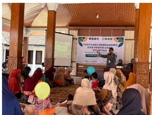
Gambar 1. Penyuluhan Stunting dan Manfaat Daun Kelor

Dalam rangka mempertahankan kewaspadaan masyarakat akan ancaman bahaya stunting serta meningkatkan inovasi olahan daun kelor yang ada di Desa Kayuapak. Penulis beserta rekan kelompok 75 melakukan penyuluhan stunting dan sosialisasi manfaat kelor ( Moringa oleifera ) di Masyarakat. Kegiatan penyuluhan stunting dan sosialisasi manfaat kelor yang dilakukan di Desa Kayuapak berlangsung sebanyak tiga kali, sebagaimana disajikan pada Gambar 1 terlihat pelaksanaan penyuluhan stunting dengan tema Posyandu Rebranding dan Penyuluhan Stunting.