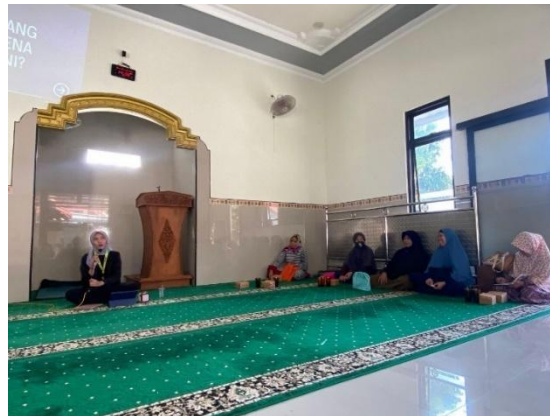
Gambar 3. Penyuluhan Stunting dan Manfaat Daun Kelor di Ranting Aisyiyah

Untuk mendukung upaya peningkatan kewaspadaan terhadap stunting dan pemanfaatan kelor, kelompok 75 membuat tujuh inovasi makanan dan minuman sehat berbahan daun kelor, yaitu donat kelor, stik bawang kelor, kelor latte, cookies kelor, marshmallow kelor, es krim kelor, dan bagelan kelor. Pada Gambar 4 menunjukkan kegiatan Pengolahan dan Demonstrasi Produk Olahan Daun Kelor.