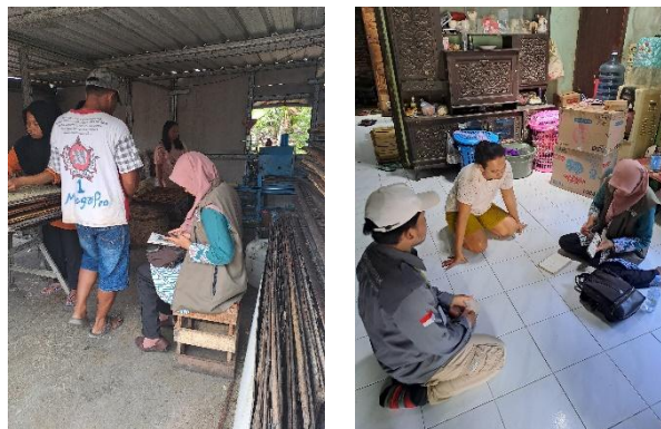
Gambar 4. Kunjungan Ke Alamat Pelaku UMKM dan Pengumpulan Berkas

Tahap pendampingan dilakukan dengan mengunjungi kembali alamat pemilik UMKM di wilayah Desa Gadingan yang akan memperoleh pendampingan dalam mengurus legalitas usaha mereka (Gambar 4). Dalam kunjungan tersebut dilakukan untuk melengkapi syarat pendaftaran berupa dokumen-dokumen yang dibutuhkan untuk pembuatan perizinan dan legalitas usaha. Selanjutnya dilakukan proses pendaftaran perizinan dan legalitas secara bertahap.