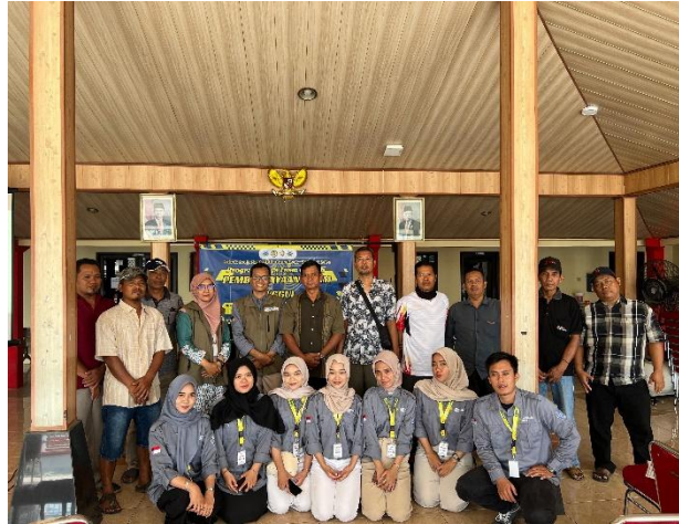
Gambar 3. Dokumentasi Pelaksanaan Sosialisasi

standar usaha, terutama jika usaha tersebut termasuk dalam kategori risiko sedang-tinggi atau rendah. Selain itu, kurangnya pemahaman para pemilik UMKM tentang kegunaan dan keuntungan legalitas usaha, ditambah dengan persepsi bahwa mengurus dokumen yang diperlukan terlalu rumit, turut memperparah masalah ini [12]. Diharapkan sosialisasi ini dapat membantu para pemilik UMKM di wilayah Desa Gadingan memahami pentingnya perizinan dan legalitas dalam mendukung perkembangan usahanya.