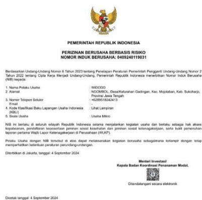
Gambar 5. Contoh NIB UMKM yang telah terbit

Setelah melakukan penerbitan Nomor Induk Berusaha (NIB) (Gambar 5), selanjutnya adalah proses pengajuan sertifikasi halal dan pengumpulan data yang nantinya akan diproses oleh pendamping. Sertifikat Halal merupakan suatu sertifikat berupa dokumen yang resmi diberikan oleh MUI untuk memastikan bahwa barang atau jasa memenuhi