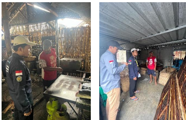
Gambar 2. Dokumentasi Survey dan Pendataan UMKM di Desa Gadingan