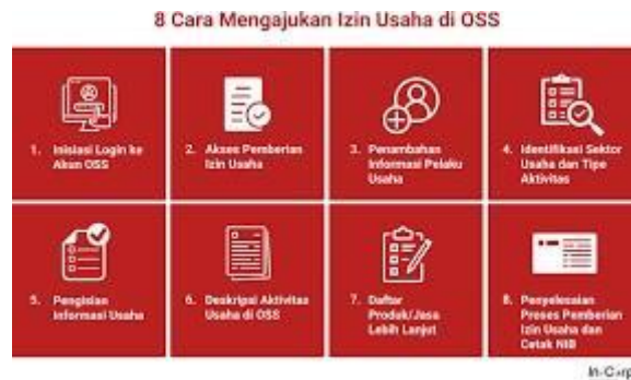
Gambar 2. Step by Step Pembuatan NIB

Berdasarkan pada Gambar 2 Proses pendaftaran NIB ini dilakukan secara mandiri oleh kelompok 81 KKN Mas Desa Jatiwarno, proses pembuatan dan penyerahan NIB ini langsung dilakukan dirumah target pelaku usaha di Dusun Klumpit Desa Jatiwarno.