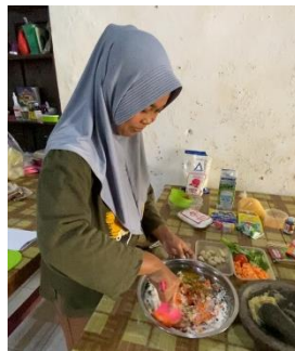
Gambar 1 Proses Take Video Kegiatan Kreasi MPASI

Program Kerja ini merupakan perlombaan MPASI. Program kerja ini berdasarkan mini observasi kepada ibu – ibu di desa dawung yang mengalami kesulitan memberikan MPASI anak karen GTM.Perlombaan ini dilakukan secara 2 tahap yakni proses take video pemasakan kreasi MPASI lalu dilanjutkan dengan pemberian informasi MPASI dan proses penjurian oleh PKU Muhammadiyah Karanganyar yang tercantum pada Gambar 1.