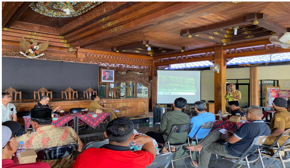
Gambar 6. Foto Kegiatan FGD Pengembangan Wisata Desa Mulur

dengan memasarkan komoditas lokal. Namun, seringkali keberhasilan pemasaran produk belum mencapai target yang diharapkan karena kesenjangan antara target pasar dengan produk yang dipasarkan, dan rendahnya motivasi pelaku usaha dalam mengembangkan produknya [10]. Salah satu upaya untuk menjembatani permasalahan tersebut ialah dengan melakukan peningkatan kapasitas dan kualitas sumber daya manusia pelaku UMKM. Sumber daya manusia yang memiliki kualitas tinggi, mampu mewujudkan keunggulan yang kompetitif bagi kemajuan UMKM. Bahkan, penyelenggaraan UMKM berkontribusi terhadap Produk Domestik Bruto dengan menyerap lebih dari 97% tenaga kerja di Indonesia (Kementerian Koordinator Bidang Perekonomian RI, 2023). Hal ini menunjukkan adanya peluang besar dalam ketersediaan lapangan kerja, sehingga mampu meningkatkan pendapatan masyarakatnya.