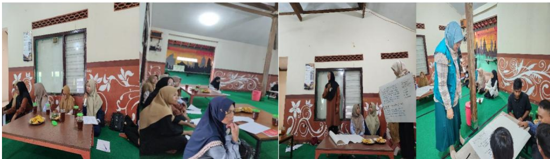
Gambar 7. Kegiatan pelatihan pencegahan stunting melalui penguatan UMKM olahan ikan nila

Kegiatan wirausaha yang dilakukan oleh Karangtaruna dan Kelompok Wanita Tani Desa Mulur dalam membuat kegiatan pelatihan ini menjadi berharga untuk pengembangan usaha kedepan. Ketekunan dan kehadiran peserta diatas 97% merupakan faktor yang memberikan kelancaran kegiatan pelatihan. Peserta antusias mengikuti kegiatan pelatihan bersama Narasumber yang terkait langsung dengan izin usaha, produk makanan olahan berbahan baku ikan Waduk yang dapat diusahakan dan registrasi produk ke BBPOM. Materi, media dan praktik langsung merupakan daya tarik bagi peserta selama kegiatan. Media pembelajaran menggunakan media cetak dan elektronik, merupakan faktor yang menyebabkan informasi dengan cepat diterima oleh peserta. Gambar 7 berikut merupakan foto kegiatan saat pelaksanaan pre-test, diskusi kelompok, dan post-test.