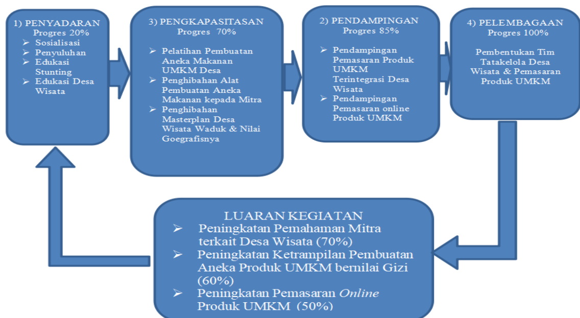
Gambar 5. Diagram alir Skema Metode Pelaksanaan PkM

Metode pelaksanaan PkM ini mengadopsi metode PALS ( Participatory Learning System ) berdasarkan Mayoux [8]. Skema pelaksanaan PkM dengan metode PALS disajikan pada diagram berikut, perubahan dijabarkan dalam tahapan pelaksanaan kegiatan terkait: (1) sosialisasi program, (2) pelatihan kepada Mitra, (3) penerapan teknologi, (4) pendampingan dan evaluasi kegiatan, dan (5) keberlanjutan program yang menjadikan rangkaian siklus kegiatan PkM ini. Pelaksanaan program PkM dikembangkan dengan metode PALS yang meliputi empat tahapan utama, yakni tahap penyadaran, tahap pengkapasitasan, tahap pendampingan, serta tahap pelembagaan. Gambar 5 berikut menggambarkan metode pelaksanaan PkM ini.