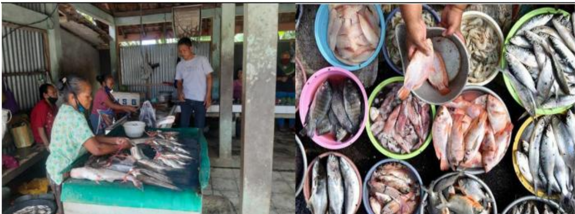
Gambar 2. Pemasaran Hasil Ikan Waduk Mulur yang kurang sehat [5].