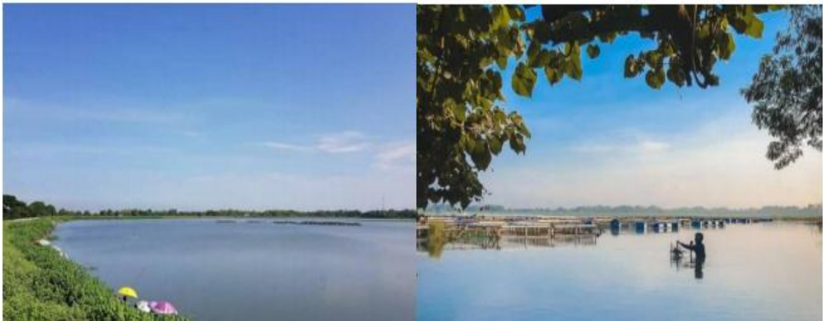
Gambar 1. Kondisi Potensi Wisata Waduk Mulur saat ini [5]

terkait potensi ikan waduk dengan kandungan gizi sebagai bahan baku makanan olahan untuk pencegahan dan pengurangan angka stunting serta pemasarannya. Kondisi waduk saat ini belum dimanfaatkan sebagai Destinasi Wisata Desa yang sekaligus untuk memasarkan produk yang berbasis UMKM dari bahan ikan di Waduk Mulur sebagaimana Gambar 1 dan 2 berikut [5]. Gambar 1 memberi informasi kondisi existing Waduk Mulur saat ini yang memerlukan pendampingan Tata Kelola Wisata Desa untuk sarana penjualan produk olahan berbahan baku ikan. Gambar 2 terkait pemasaran hasil ikan waduk yang kurang sehat dan masih berupa ikan mentahan dengan nilai ekonomi yang rendah, sehingga memerlukan pendampingan produk olahan berbahan baku ikan untuk meningkatkan kesejahterannya. Adapun secara administratif Desa Mulur (Gambar 3), sebelah utara berbatasan dengan Desa Sugihan dan Toriyo di sebelah utara, dengan Desa Mertan di sebelah timurnya, Desa Jagan di sebelah selatan, dan Kecamatan Sukoharjo di sebelah baratnya.