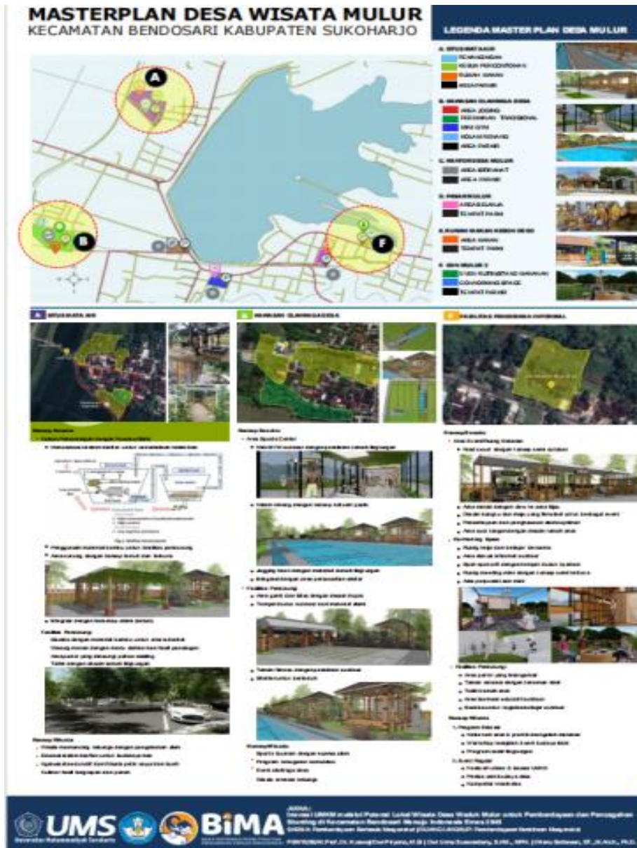
Gambar 6. Masterplan Desa Wisata Mulur

Tim PkM melalui FGD tersebut telah memaparkan hasil survei pemanfaatan lahan kas Desa untuk kegiatan destinasi Pariwisata Desa Wisata Mulur. Masterplan yang dihasilkan tidak terkait langsung dengan areal Waduk Mulur, karena area waduk menjadi aset Pemerintah Provinsi sebagai aset budaya. Pengembangan Desa Wisata Mulur difokuskan pada 3 area lahan yang merupakan aset desa saja. Dalam branding Desa Wisata, perlu dipahami bahwa secara toponimi bahwa nama "Mulur" pada Waduk Mulur memiliki nuansa khas Jawa yang sering kali dikaitkan dengan sejarah panjang budaya dan kerajaan di wilayah tersebut. Meskipun tidak ada bukti langsung yang menunjukkan hubungan nama "Mulur" dengan kerajaan tertentu, beberapa pendapat dan tradisi lisan menyebutkan kemungkinan kaitannya dengan aspek sejarah dan kosmologi Jawa. Berdasarkan konsep masterplan Tim PkM telah dipahami oleh Mitra sebagaimana Gambar 6 berikut.