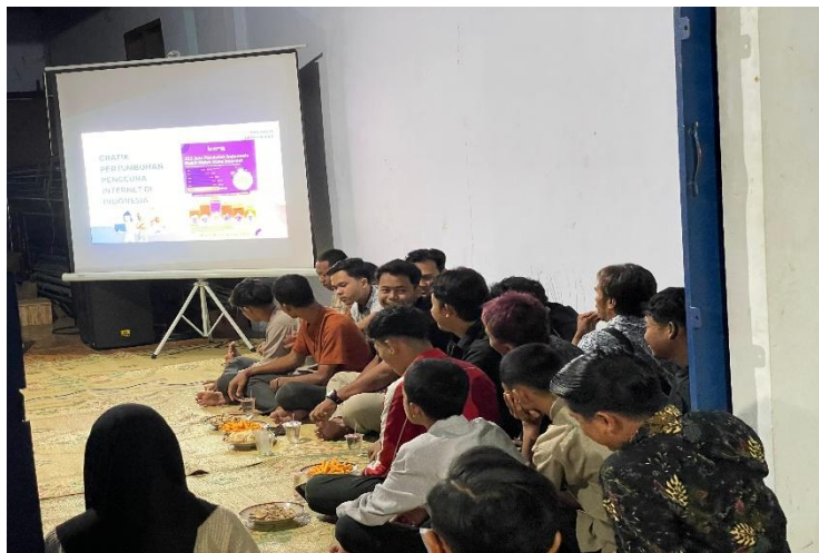
Gambar 3. Penyampaian materi digital marketing pada UMKM