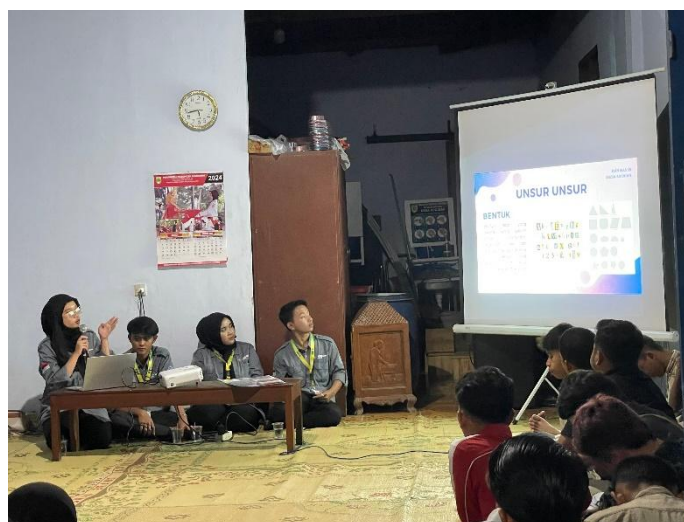
Gambar 6. Penayangan video Langkah-langkah pembuatan desain grafis