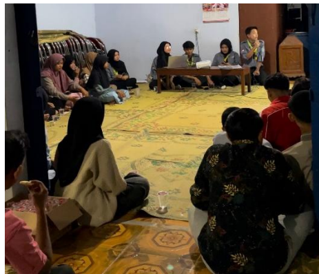
Gambar 4. Penyampaian materi pentingnya branding

Pada materi kedua ini memaparkan pentingnya branding demi meningkatkan usahanya melalui langkah-langkah dalam memberanding usaha, tantangan dalam melakukan branding, dan memberikan satu contoh penerapan branding pada salah satu brand kopi. Tujuan adanya materi ini untuk memberikan kesadaran bagi para pelaku UMKM untuk memiliki brand agar dapat membedakan usaha dengan para pesaing, membangun kepercayaan konsumen, meningkatkan daya saing, loyalitas pelanggan, dan memudahkan pemasaran serta meningkatkan nilai bisnis (Rezky et al. 2021).