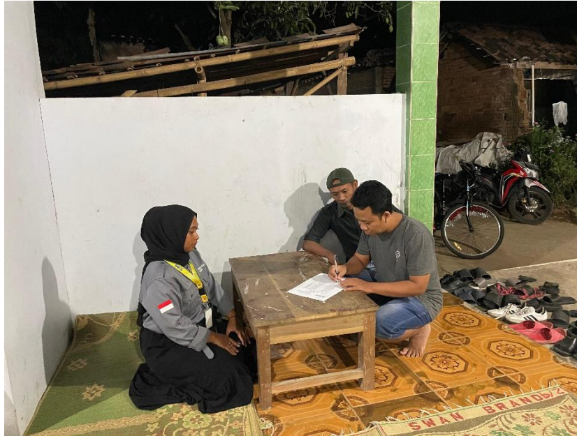
Gambar 2. Kegiatan sosialisasi