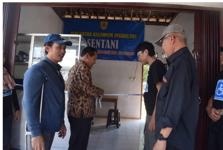
Gambar.4 Peresmian Gedung Produksi dan Sekretariat Difabel Sentani

Menuju acara berikut berupa peresmian gedung produksi dan sekretariat yang disahkan oleh kepala desa gentan untuk meningkatkan tanggung jawab atas hak guna Badan Usaha Milik Desa (BUMDES) untuk peningkatan hasil produksi yang lebih baik dan maksimal. Peresmian simbolis ini menjadi daya tarik karena bertempat dipinggir jalan dan usaha dari mereka dapat terlihat karena sebelum dipindahkan bertempat dirumah yang jauh dengan jalan dengan ini juga memaksimalkan usaha dalam jasa jahir atau pembuatan konveksi produk.