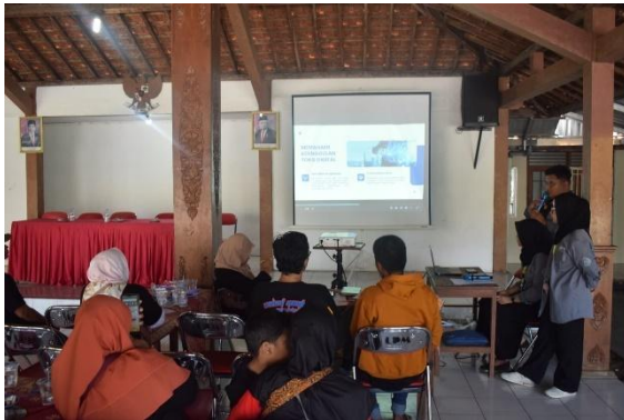
Gambar.5 Sosialisasi Digital Market

telah dibuat. Manajemen market dalam pengelolaan produk dibuat dengan template Input Atau Output data pada produk dan daftar konveksi jahit yang mampu untuk dikreatifkan.