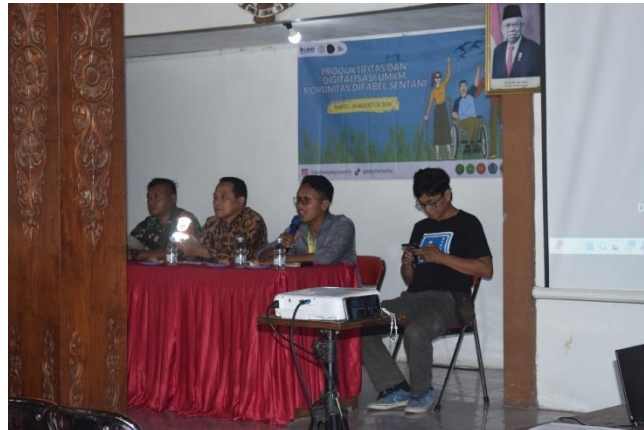
Gambar.3 Penyampain Saran dan Masukan Difabel Sentani

Tahap aksi ini mulai dilaksanakan pada Hari Sabtu, 24 Agustus 2024 di waktu pagi hari dan dihadiri oleh tamu undangan. Dalam agenda pertama adalah Acara resmi dengan sambutan Oleh berbagai pihak dan saat acara diberikan sesi saran dan masukan bagi tamu undangan untuk memberikan saran dan masukan kepada Komunitas Difabel Sentani. Masukan ini memberikan dorongan kuat untuk menjadi lebih semangat meningkatkan kemampuan dan kemandirian individu.