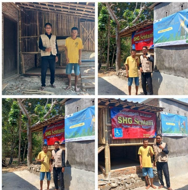
Gambar.12 Kandang Kambing Difabel Sentani