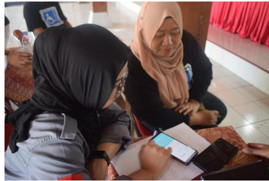
Gambar.6 Pelatihan Canva