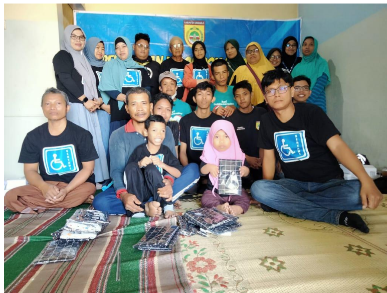
Gambar.2 FGD bersama Komunitas Difabel Sentani

Sejalan dengan tema KKNMas dalam UMKM adanya peembicaraan lebih lanjut yang disampaikan oleh Kelompok KKNMas yang kemudian dilaksanakan FGD kembali pada saat perkumpulan difabel.