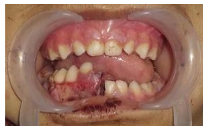
Gambar 2. Gambaran intraoral pasien.

Pada pemeriksaan intraoral memperlihatkan adanya laserasi pada regio mesial gigi 71 dan 81, terdapat maloklusi, diskontinuitas mandibula dengan pergeseran fragmen mandibula dextra ke lingual dan superior, hematoma sublingual, avulsi gigi 81, avulsi gingiva cekat di regio gigi 83-84.