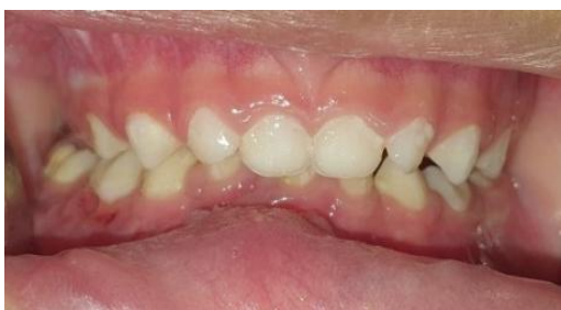
Gambar 8. Gambaran klinis intraoral pasien setelah pelepasan thermoformed splint dan circummandibular wiring , oklusi membaik.

Evaluasi radiografi CT scan kepala dan CT 3D pada saat 2 bulan paska operasi mengkonfirmasi fragmen fraktur tereduksi dengan baik, alignmen terkoreksi, tampak adanya penyatuan fragmen faktor simfisis mandibula (Gambar 9 dan 10).