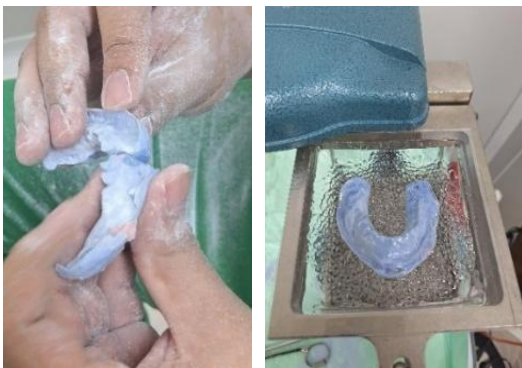
Gambar 4. Proses pembuatan thermoformed splint durate operasi.

Setelah dilakukan pencetakan rahang dengan bahan cetak alginate dan dental stone , fragmen fraktur dipisahkan dan direduksi secara manual pada gips untuk mensimulasikan reduksi yang akan dilakukan secara klinis dan kemudian dicetak kembali sehingga didapatkan cetakan mandibula yang sudah tereduksi dengan baik. Lembaran termoplastik transparan dengan ketebalan 1 mm ditekan pada cetakan mandibula yang sudah tereduksi dengan bantuan vacuum-forming machine . Tepi splint dipotong menggunakan gunting atau bur akrilik pada regio undercut 2 mm di bawah margin gingiva bebas dan frenulum labialis sebagai retensi mekanis tambahan. Tepi splint dihaluskan untuk mencegah iritasi pada mukosa rongga mulut (Gambar 4).