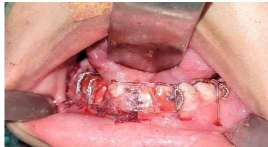
Gambar 5. Thermoformed splint yang dibuat saat durate operasi dipasang pada mandibula dan difiksasi dengan circummandibular wiring .

Pasien dilakukan tindakan reduksi fragmen fraktur secara manual dan disejajarkan dengan tekanan bi-digital pada regio lingual dan margoinferior simfisis mandibula untuk menjaga alignment fragmen fraktur dengan panduan pada oklusi pasien. Laserasi dijahit dengan benang vycril 4.0. Thermoformed splint dipasang pada mandibula yang sudah tereduksi dan difiksasi dengan 4 buah circummandibular wiring pada regio kanan dan kiri garis fraktur menggunakan kawat stainless steel 0,5 mm (Gambar 5).