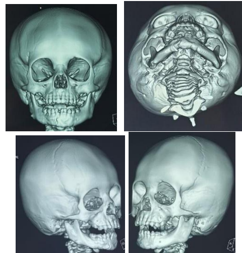
Gambar 9. Foto CT scan 3 Dimensi pada saat 2 bulan post operasi. Tampak gambaran osteointegrasi diregio simfisis mandibula

Evaluasi radiografi CT scan kepala dan CT 3D pada saat 2 bulan paska operasi mengkonfirmasi fragmen fraktur tereduksi dengan baik, alignmen terkoreksi, tampak adanya penyatuan fragmen faktor simfisis mandibula (Gambar 9 dan 10).