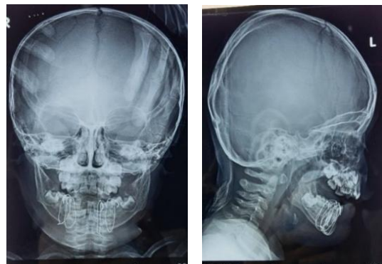
Gambar 6. Foto Cranium AP Lateral pasca operasi. Tampak gambaran fragmen fraktur tereduksi dengan baik, alignment tepi bawah mandibula terkoreksi.

Orang tua pasien diinstruksikan untuk memberikan diet cair atau bubur saring tinggi karbohidrat dan tinggi protein serta penggunaan obat kumur untuk menjaga kebersihan rongga mulutnya. Observasi pasca operasi dilakukan setiap minggu pada bulan pertama untuk memantau adanya kemungkinan komplikasi pasca operasi, kontrol selanjutnya bulan ke 2 dan tiap 6 bulan. Radiografi foto polos setelah operasi dilakukan untuk mengevaluasi hasil operasi. Pada radiografi Cranium Anteroposterior dan Lateral pasca operasi menunjukkan fragmen fraktur tereduksi dengan baik dan alignment margo inferior mandibula terkoreksi (Gambar 6). Pada pemeriksaan klinis menunjukkan oklusi pasien membaik. Saat rawat jalan, pasien diresepkan obat amoxicilin sirup 200 mg tiap delapan jam, parasetamol sirup 300 mg tiap delapan jam selama 5 hari dan betadin gargle.