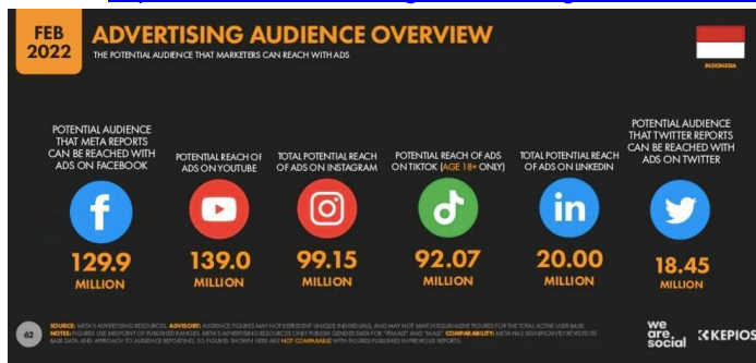
Gambar 2. Traffic Generator Website Dari Media Sosial di Indonesia 2022