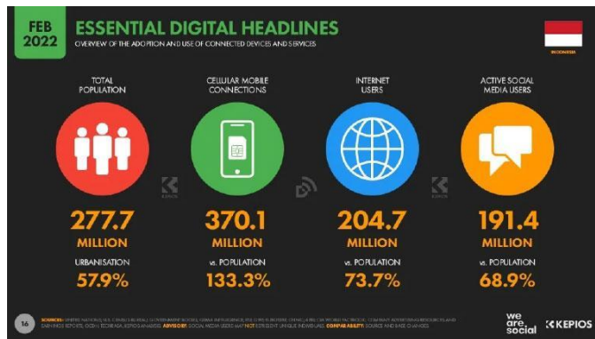
Gambar 1. Statistik pengguna internet di Indonesia 2022

banyaknya dalam memahami bagaimana penggunaan platform digital dengan maksimal. Dengan rata rata 8 jam lebih per hari dalam penggunaan akses internet dan banyak pengguna smartphone dari masyarakat Indonesia menghabiskan waktu mereka hampir 5 jam, dan masyarakat lainnya menggunakan komputer/laptop hampir 4 jam. Maka dari itu para pelaku bisnis di Indonesia harus memiliki skill yang kompeten dalam pembuatan website yang bisa diakses dari segala macam bentuk perangkat elektronik dan tentunya responsive agar memiliki tampilan yang maksimal. Kemudian dilanjut dengan penyajian gambar maupun video harus ditampilkan dengan resolusi terbaik agar informasi bisa tersampaikan dengan baik dan penyajian copywriting yang jelas dan menggunakan kalimat se efisien mungkin.