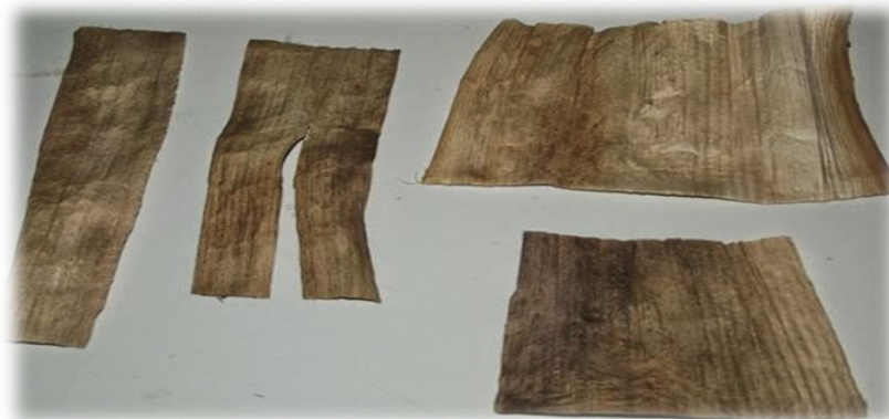
Gambar 3. Pelepah pisang setelah dikeringkan

Pengeringan menggunakan sinar matahari penuh membutuhkan waktu 2-3 hari, apabila dengan oven akan membutuhkan waktu 2 jam pada suhu 80°-90° C, Tetapi dengan cara ini kadang membuat pelepah pisang menjadi getas, mudah robek, rapuh atau berwarna kusam, Selanjutnya disimpan di tempat yang kering atau tidak lembab supaya pelepah tidak berjamur, Setelah proses pengeringan selesai pelepah pisang yang sudah kering dirapikan dengan cara disetrika dengan suhu sedang antara 40° - 50° C, Tujuan dengan menggunakan suhu yang sedang adalah supaya pelepah tidak terlalu kering dan tidak gosong warnanya, Setelah semua proses pengeringan dan sudah dirapikan maka bahan baku wallpaper sudah siap untuk diproses selanjutnya ( Rukmana, Rahmat : 2006 ).