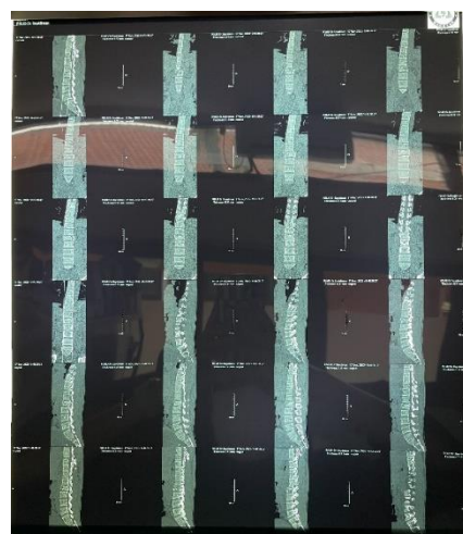
, Gambar 4. CT scan thoracolumbal