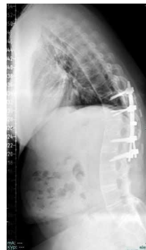
Gambar 2. Foto Polos Lateral