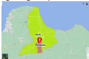
Gambar 1. Letak Kecamatan Tambakromo

Kecamatan Tambakromo merupakan kecamatan yang terletak di Kabupaten Pati Jawa Tengah, lebih tepatnya berada disebelah selatan Kabupaten Pati. Daerah ini didominasi oleh dataran yang terbentang lahan tebu, dan sebagian lainnya merupakan pegunungan kapur.