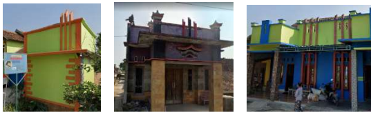
Gambar 2. Pengaplikasian Ornamen

Bentuk ornamen yang akan dikaji oleh peneliti adalah ornamen yang diaplikasikan di atap teras atau menghimpit jendela. Dengan 3 persegi yang memanjang keatas dan tidak jarang juga ujungnya lancip. menurut jenis motif, ornamen ini masuk kedalam ornamen dengan motif geometris karena merupakan perpaduan antara garis lurus, persegi, dan segitiga dengan pola simetris yakni pola yang memiliki bentuk seimbang antara kanan dan kiri.