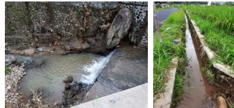
Gambar 13. Kondisi Irigasi Desa Salam