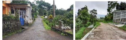
Gambar 11. Akses Jalan Desa