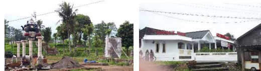
Gambar 14. Taman Patung Semar dan Pabrik Getuk Semar di Desa Salam