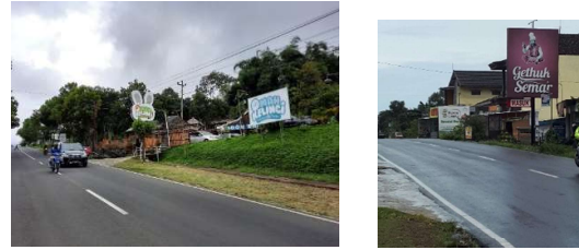
Gambar 10. Akses Jalan Utama Desa Salam

Selain itu juga terdapat beberapa hasil dokumentasi yang menunjukkan kondisi eksisting Desa Salam, antara lain sebagai berikut: