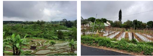
Gambar 12. Kondisi Lahan Pertanian di Desa Salam