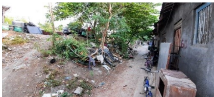
Gambar 3. Kondisi Jalan Gang