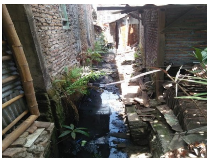
Gambar 4. Kondisi Drainase