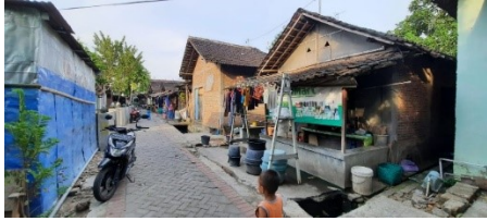
Gambar 2. Permukiman Kumuh