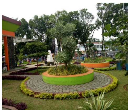
Gambar 2. Taman Kota