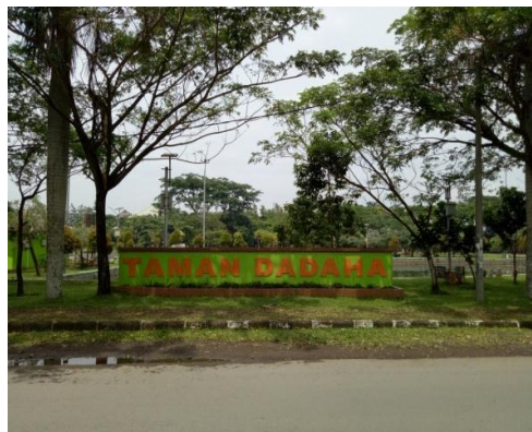
Gambar 1. Kompleks Dadaha

Ruang terbuka hijau publik di Kecamatan Cihideung berupa Taman Hijau dan Hutan Kota. Kondisi taman dan hutan kota yang ada di Kecamatan Cihideung terawat dengan baik. Taman kota yang ada difungsikan sebagai sarana rekreasi, sarana olahraga, edukasi dan paru-paru kota sebagai penghasil oksigen. Sedangkan hutan kota memiliki fungsi dan manfaat sebagai pengatur iklim mikro, peresapan air hujan, pengendali polusi dan emisi.