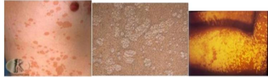
Gambar 2. Gambaran klinis PV berdasarkan bentuk lesi. A. Bentuk makuler B. Bentuk papuler. C. Bentuk perifolikuler. 2