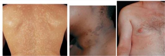
Gambar 1. Gambaran klinis PV berdasarkan warna lesi. A. Lesi hiperpigmentasi karena hiperemia akibat respon inflamasi dan peningkatan melanin. B. Lesi hipopigmentasi, batas jelas dengan skuama tipis. 2

Lesi akan menjadi bercak yang luas, tersebar atau berkonfluens pada lesi yang sudah lama. Lesi mempunyai bentuk bervariasi seperti bentuk papuler ataupun perifolikuler. Umumnya predileksi dimulai dari atas yaitu punggung atas atau dada meluas ke bahu menjalar ke lengan atas, kemudian perut bahkan akan meluas ke panggul, tungkai atas hingga tungkai bawah bila penyakit tidak segera diobati. Lesi juga dapat mengenai aksila atau inguinal meskipun jarang terjadi yang disebut dengan tipe inversa. Selain itu juga dapat muncul pada telapak tangan atau genitalia. Bentuk atrofikans, periareolar atau imbrikat merupakan variasi klinis yang jarang terjadi dan dilaporkan secara sporadik.