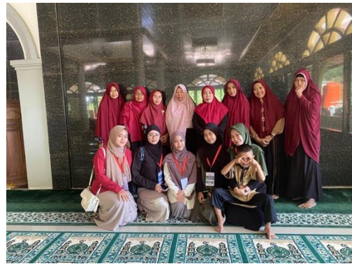
Gambar 7. Pengajian majlis talim