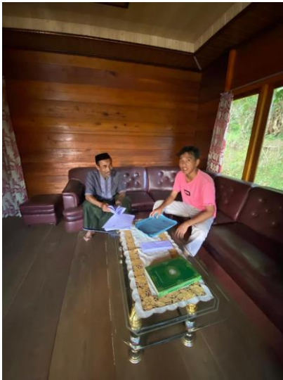
Gambar 4 mengunjungi tokoh desa khutbah