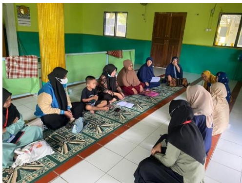
Gambar 6. Pengajian majlis talim