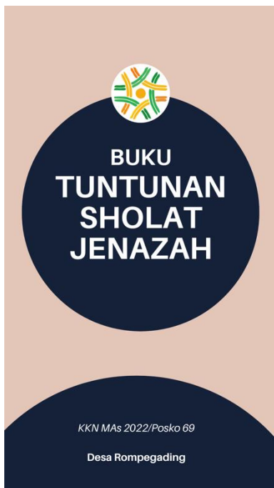
Gambar 2 Cover buku saku

Setelah kegiatan terlaksana mahasiswa juga membantu agar kegiatan tersebut tidak hanya menjadi angin lalu. Mahasiswa berinisiatif untuk memberikan buku khutbah disetiap masjid agar bisa menjadi refrensi masyarakat saat imam desa tidak dapat hadir. Penyerah buku saku dengan buku khutbah diberikan secara perwakilan oleh imam desa dan terdokumentasi pada gambar 5. Selain itu juga memberikan buku saku tuntunan shalat jenazah seperti gambar 1 dan 2.