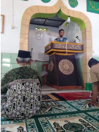
Gambar 8. Praktek sholat jenazah