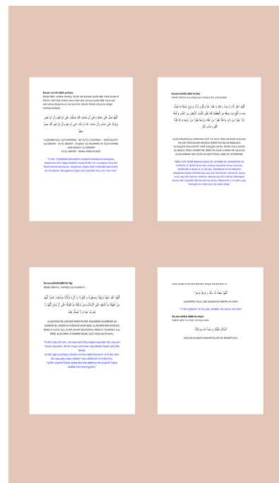
Gambar 3 Isi buku saku