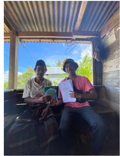
Gambar 5 penyerahan buku