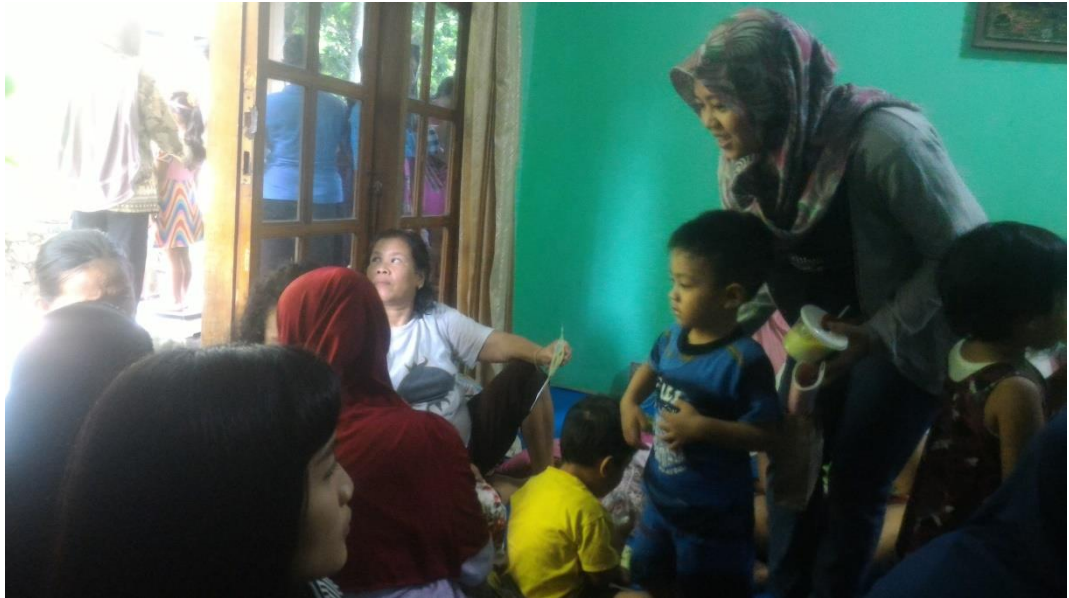
Gambar 1. Ramainya Suasana Penyuluhan

September 2020 tentang tumbuh kembang anak. Penelitian dan penyuluhan ini dibantu oleh bidan desa tersebut untuk mengumpulkan peserta. Sebanyak 21 orangtua hadir bersama anaknya ke lokasi penyuluhan.