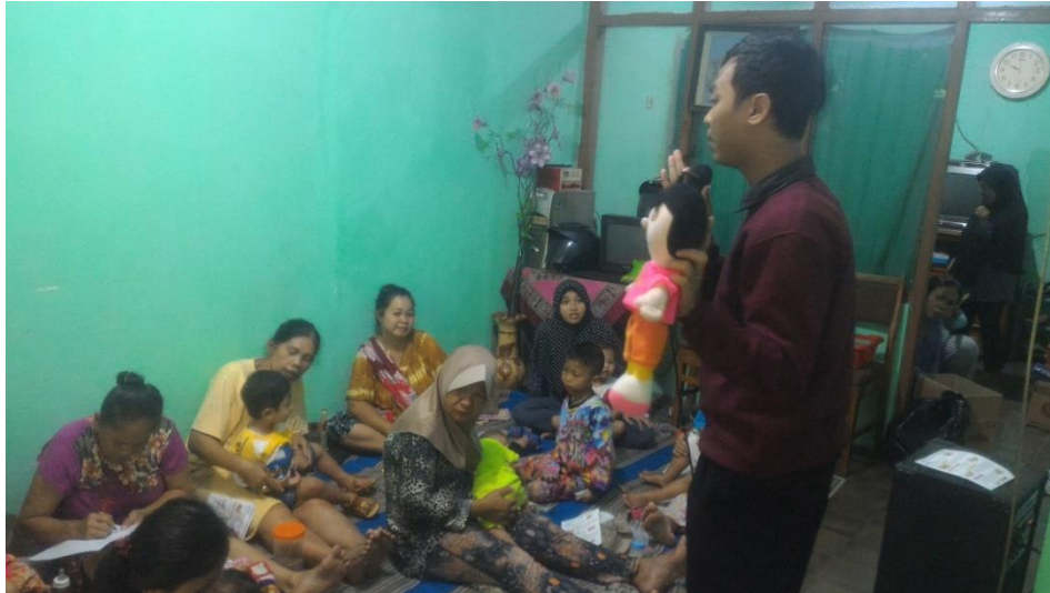
Gambar 2. Pemberian Materi Tumbuh Kembang