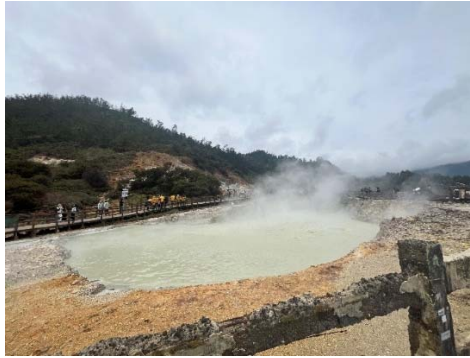
Gambar 1. Kawasan Objek Wisata Kawah Sikidang

memadai serta ketersediaan fasilitas yang semakin berkembang turut menunjang kenyamanan dan kemudahan dalam menjangkau lokasi-lokasi tersebut. Faktor-faktor tersebut menjadikan objek wisata seperti Candi Arjuna, Kawah Sikidang, dan Museum Kailasa sebagai destinasi utama yang banyak diminati oleh pengunjung yang ingin menikmati kekayaan alam dan budaya kawasan Dieng.