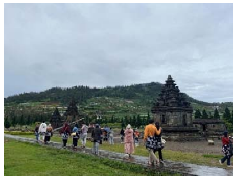
Gambar 2. Kawasan Objek Wisata Candi Arjuna