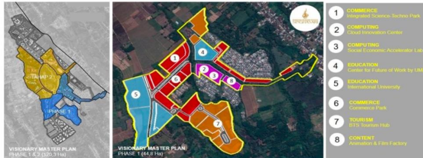
Gambar 1. Masterplan Wilayah KEK Singhasari

sektor akomodasi dan makan minum hanya tumbuh sebesar 0,02%. Sementara itu, bidang pendidikan dikembangkan melalui kerja sama dengan Universitas Muhammadiyah Malang dan King's College London . Proyeksi kebutuhan tenaga kerja hingga tahun 2028 diperkirakan mencapai lebih dari 17.000 orang, terutama dari lulusan SMK kejuruan, diploma, dan universitas (Kementerian Ketenagakerjaan RI, 2023).