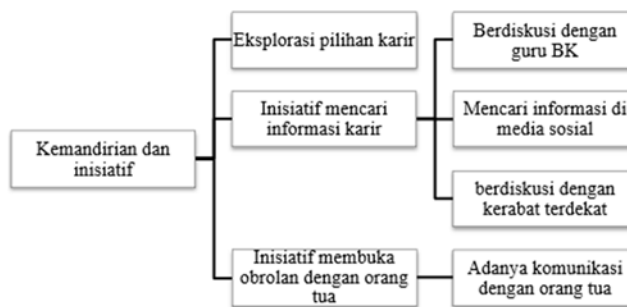
Gambar 2. Kemandirian dan Inisiatif

Pada proses pengambilan keputusan karir, ketiga informan mengungkapkan bahwa orang tua mereka tidak memaksakan pilihan karir tertentu, melainkan memberikan kebebasan untuk mengeksplorasi minat dan bakat mereka. Kebebasan yang diberikan menimbulkan adanya kemandirian dan inisiatif informan yang tinggi untuk membuka diskusi dengan orang tua mengenai karir. Hal tersebut memunculkan adanya pola komunikasi terbuka ( pluralistic ) yang dominan dalam keluarga informan. Orang tua merupakan tipe yang terbuka dan mendorong anak mereka untuk berdiskusi secara bebas mengenai pilihan karir yang akan diambil.