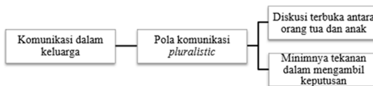
Gambar 3. Komunikasi dalam Keluarga

tinggi dalam mengeksplorasi pilihan karir mereka sebelum berdiskusi dengan orang tua. Ketiga informan juga aktif mencari informan dari berbagai sumber, seperti guru BK, media sosial, dan kerabat dekat. Hal ini juga sesuai dengan karakteristik Generasi Z yang cenderung individualistis dan lebih suka menyelesaikan masalah sendiri sebelum meminta bantuan orang lain. Kemandirian ini juga ditunjukkan dari kemampuan informan untuk memulai diskusi dengan orang tua mengenai pilihan karir mereka, menunjukkan bahwa informan tidak sepenuhnya bergantung pada orang tua tetapi tetap melibatkan mereka sebagai sumber dukungan dan pertimbangan.