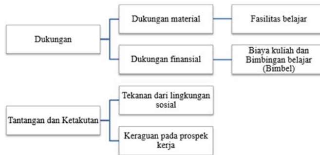
Gambar 4. Dukungan dan Ketakutan

Pada penelitian ini, orang tua informan tidak hanya memberikan nasihat tetapi juga memfasilitasi anak dengan menyediakan sumber daya yang dibutuhkan. Dukungan ini memberikan dampak positif, seperti meningkatkan semangat dan kepercayaan diri anak. Selain itu, lingkungan keluarga yang supportif juga membantu anak merasa lebih optimis tentang masa depan mereka. Meskipun mendapatkan dukungan, informan juga menghadapi ketakutan dan keraguan dalam mengambil keputusan karir, terutama terkait prospek kerja di masa depan. Meskipun ada perasaan ragu karena reaksi lingkungan sekitar, informan tetap percaya diri untuk memiliki jurusan yang diinginkannya.