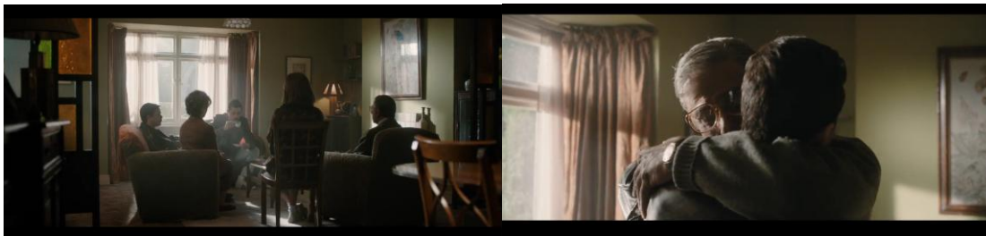
Gambar 5. Freddie kembali mengunjungi rumah keluarganya

Secara konotatif, adegan ini memuat simbolisasi tentang kontrol diri, identitas, dan perlawanan terhadap stigma. Kalimat "Aku yang menentukan siapa diriku" menjadi deklarasi tegas Freddie bahwa ia menolak dikendalikan oleh penyakit maupun stereotip sosial. Dalam teori semiotika Christian Metz, momen ini dapat dibaca sebagai kode simbolik yang menghubungkan narasi film dengan makna yang lebih dalam tentang subjektivitas dan eksistensi. Penyakit AIDS yang kerap distigmatisasi menjadi latar krisis identitas, namun justru digunakan Freddie untuk merebut kembali agensinya melalui musik. Dialog, ekspresi wajah, dan pencahayaan menjadi penanda visual yang membentuk sistem tanda sinematik, menciptakan makna ganda: penderitaan sekaligus pembebasan. Dengan demikian, adegan ini merepresentasikan musik bukan hanya sebagai bentuk ekspresi artistik, tetapi juga sebagai sarana penegasan identitas dalam menghadapi kematian.