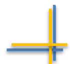
Tabel 9. Kategorisasi Motivasi Belajar

Tabel 8 memperlihatkan bahwa subjek dalam penelitian ini memiliki Rerata Empirik (RE) sebesar 66,65 yang berada pada kategori sedang. Nilai tersebut lebih tinggi dari Rerata Hipotetik (RH) yaitu 60. Tabel di atas memperlihatkan 18 mahasiswa (12%) terhitung mempunyai keaktifan berorganisasi yang rendah, 74 mahasiswa (49,3%) terhitung mempunyai keaktifan berorganisasi yang sedang, 58 mahasiswa (38,7%) terhitung mempunyai keaktifan berorganisasi yang tinggi.