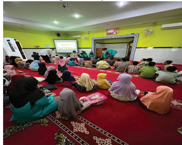
Gambar 1. Metode pembelajaran dengan memanfaatkan teknologi

Sebagaimana disajikan dalam gambar 1. Disini kami menerapkan pembelajaran dengan memanfaatkan teknologi. Materi yang kami sampaikan adalah zakat. Terlihat anak-anak menyukai dan lebih memahami materi yang telah disampaikan. Kami menayangkan beberapa film animasi yang sesuai dengan materi, tidak hanya itu beberapa games kecil juga kami terapkan dalam pembelajaran ini. Hal tersebut mendapat respon yang cukup baik, dapat dilihat dari antusias anak-anak dalam setiap pertemuannya. Anak-anak terlihat lebih bersemangat dan berkonsentrasi dalam belajar Al-Qur'an, hal tersebutlah yang menjadi tujuan kami menumbuhkan kesadaran dan minat mereka untuk gemar belajar Al-Qur'an.