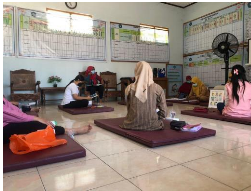
Gambar 1. Kelas Ibu Hamil Bersama Bidan Desa dan Bidan Puskesmas

Penanggulangan masalah stunting harus dimulai dari sebelum anak dilahirkan atau anak masih terdapat di dalam kandungan dan bahkan dimulai sejak remaja untuk dapat memutus rantai stunting dalam siklus kehidupan. Oleh karena itu, perlu persiapan terkait kehamilan terutama dalam pemenuhan gizi yang baik dan benar yang dilakukan sejak masa persiapan atau sebelum kehamilan sehingga pencegahan stunting terhadap balita dapat terlaksanakan dengan optimal.