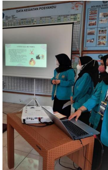
Gambar 2. Penyuluhan Stunting kepada Ibu Hamil