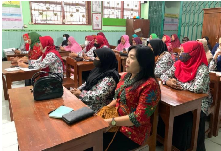
Gambar 1. Kegiatan Penyuluhan di Kelurahan Ngadirejo