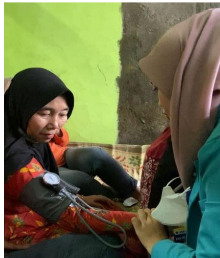
Gambar 2. Pengukuran Tekanan Darah