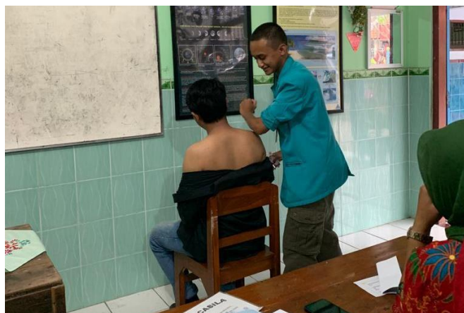
Gambar 3. Kegiatan Pelatihan myofascial release ischemic compression