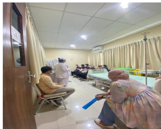
Gambar 2. Proses Penyuluhan Kegiatan Pendidikan Kesehatan