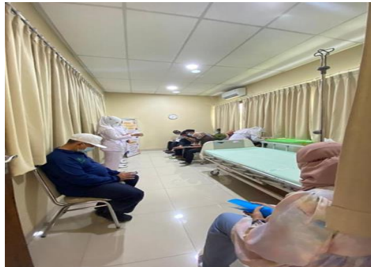
Gambar 1. Peserta Mengisi Kuesioner Pre Test Selama 10 menit

membutuhkan peranan keluarga dalam mencapai kesembuhan (Novitasari, 2014). Dukungan tersebut dapat berupa upaya yang dilakukan keluarga untuk pencegahan TB paru adalah: (1) Menjauhkan anggota keluarga lain dari penderita TB paru saat batuk; (2) Menghindari penularan melalui dahak pasien penderita TB Paru; (3) Membuka jendela rumah untuk pencegahan penularan TB paru dalam keluarga; (4) Menjemur kasur pasien TB paru untuk pencegahan penularan TB paru dalam keluarga (Jaji, 2010 cit Suarnianti et al., 2021).