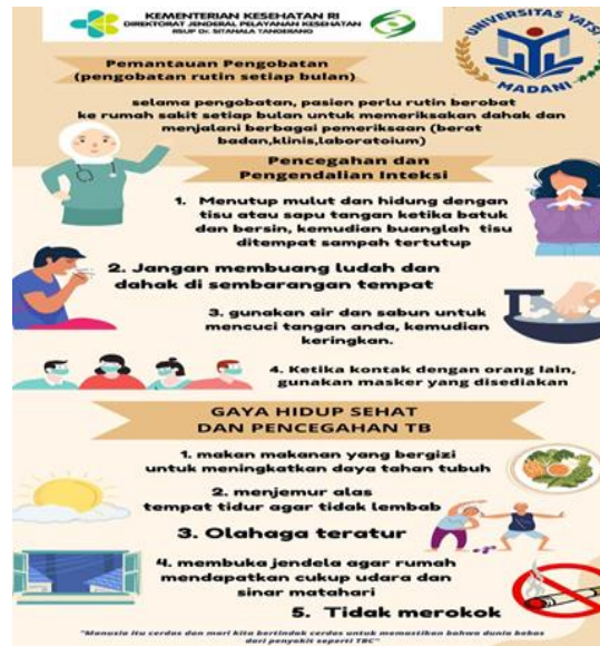
Gambar 4. Poster Pendidikan Kesehatan