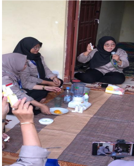
Gambar 2. Demonstrasi pembuatan