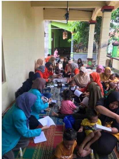
Gambar 1. Pelaksanaan Sosialisasi

tidak hanya memberikan manfaat bagi peserta, tetapi juga berpotensi menciptakan dampak yang lebih luas bagi masyarakat