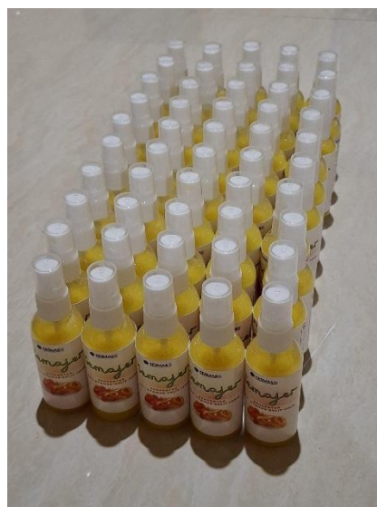
Gambar 3. Produk SEMAJER (Semprotan Anti Nyamuk Kulit Jeruk)

Setelah pemaparan mengenai bahaya Demam Berdarah Dengue (DBD), kegiatan dilanjutkan dengan demonstrasi pembuatan SEMAJER (Semprotan Anti Nyamuk Kulit Jeruk) yang sangat dinantikan. Para mahasiswa dengan cermat menjelaskan setiap tahap pembuatan, mulai dari pemilihan bahan hingga proses pengolahan. Demonstrasi langsung ini memberikan pemahaman yang lebih mendalam bagi para lansia dan kader posyandu. Tidak hanya sekadar membuat semprotan, kegiatan ini juga memberikan keterampilan berharga kepada para lansia. Mereka belajar membuat produk pembersih alami yang efektif mengusir nyamuk sekaligus ramah lingkungan. Dengan demikian, lansia tidak hanya berperan aktif dalam menjaga kesehatan diri dan keluarga, tetapi juga berkontribusi dalam pelestarian lingkungan. Selain itu,