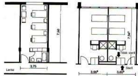
Gambar 1. Ruang Perawatan