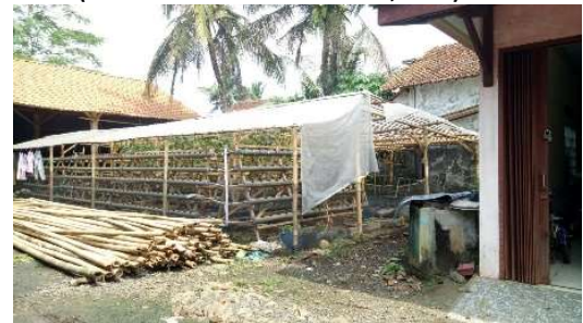
Gambar 5 Vertical Garden