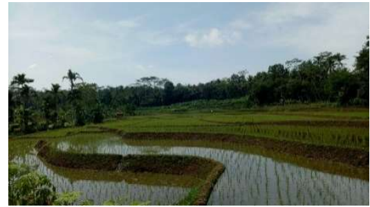
Gambar 4 Sawah Desa Sudimara

Desa Sudimara memiliki 2 kelompok tani dan paguyuban penderes gula kristal.