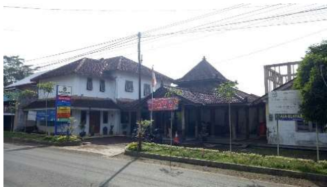
Gambar 7 Balai Desa Sudimara (Sumber: Dokumentasi Pribadi, 2020)

Balai Desa Sudimara merupakan kantor desa yang mengurus bagian administrasi desa, namun juga digunakan sebagai tempat pelatihan dan kegiatan berkumpul maupun musyawarah masyarakat desa.