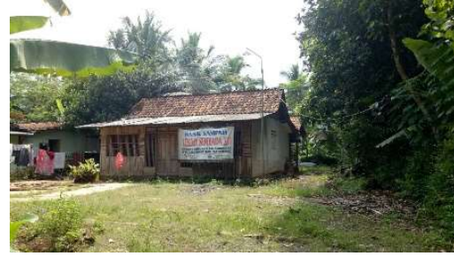
Gambar 8 Bank Sampah Desa Sudimara

Bank sampah Desa Sudimara sudah berdiri selama 2 tahun dan dikelola oleh Karang Taruna Tekad Sembada IX dengan pelayanan jemput sampah hingga keluar desa.