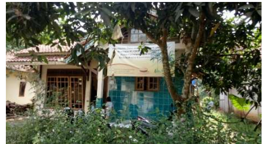
Gambar 6 Industri Gula Kelapa

Desa Sudimara memiliki banyak industri, seperti industri gula kelapa, kayu sengon, bambu wulung dan masih banyak lainnya. Pemerintah desa sangat mendukung pengembangan industri Desa Sudimara. Hal ini dapat dibuktikan dengan adanya peran aktif pemerintah desa dalam mengadakan pelatihan pembuatan sangkar burung bagi usia produktif. Pemerintah desa juga berencana mengadakan pelatihan-pelatihan lainnya, seperti pelatihan ulat sutra meskipun belum sempat terlaksana.