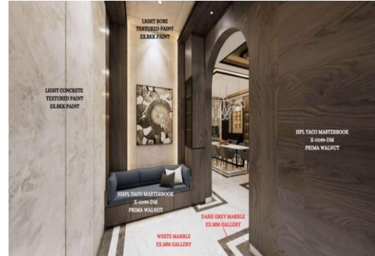
Gambar 6. Sirkulasi living room

Penempatan furnitur pada posisi yang benar membawa energi positif di dalam rumah. Hindari meletakkan furnitur di tengah ruangan dan menghalangi pintu.