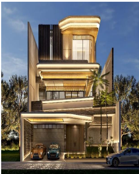
Gambar 5. Fasad PBV house (sumber: Steven Lim Architects, 2023)

Pemilihan warna dalam konsep feng shui juga memiliki peran penting. Warna memiliki simbol dan arti tertentu. Penggunaan warna yang selaras seperti pada PBV House yaitu coklat dan kuning sering dihubungkan dengan elemen tanah yang memiliki arti dapat menciptakan harmoni visual serta stabilitas dan keseimbangan.