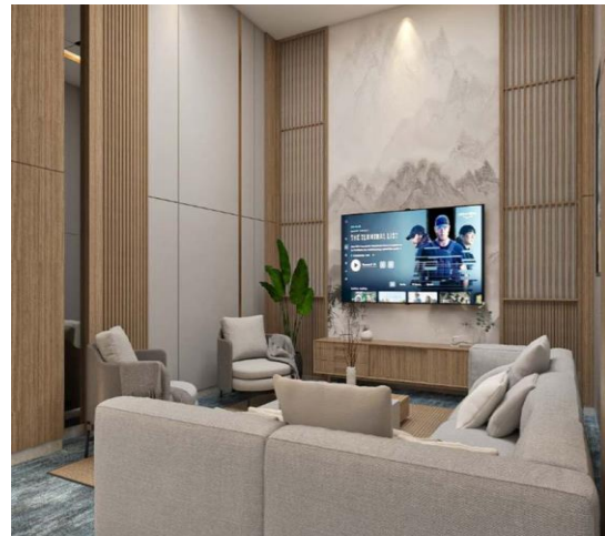
Gambar 3. PBV House Exterior (sumber: Steven Lim Architects, 2023)

shui mendorong untuk menciptakan ruang yang teratur dan membuka, menciptakan kesan keterbukaan dan keseimbangan. Pemilihan material juga dipertimbangkan dengan cermat dalam feng shui . Material alami seperti kayu dan batu dianggap memiliki energi yang mendukung dan harmonis. Integrasi material ini menciptakan perasaan kehangatan dan koneksi dengan alam dalam ruang interior (Hadi et al. , 2022).