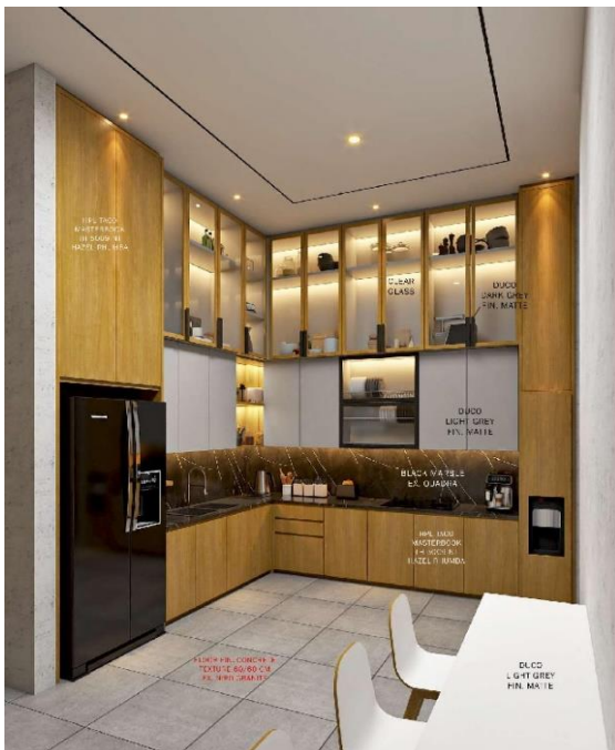
Gambar 2. Taman Surya

Pilih warna yang sesuai dengan elemen dapur, seperti unsur api. Warna-warna cerah seperti merah atau oranye dapat memberikan semangat dan energi positif. Namun, pastikan tidak terlalu berlebihan sehingga menciptakan energi yang terlalu kuat. Dapur sebaiknya selalu rapi dan bersih. Kesehatan dan keseimbangan energi terjaga ketika dapur terorganisir dan bebas dari kekacauan (Mariana, 2015).