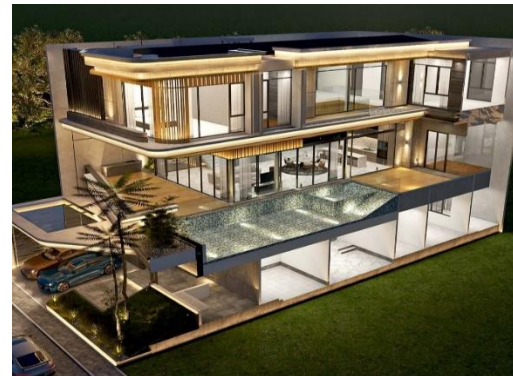
Gambar 7. PBV house (sumber: Steven Lim Architects, 2023)