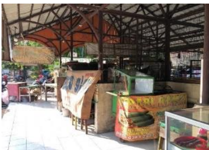
Gambar 7. Gerai Pedagang