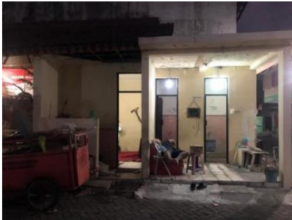
Gambar 5. Kamar Mandi