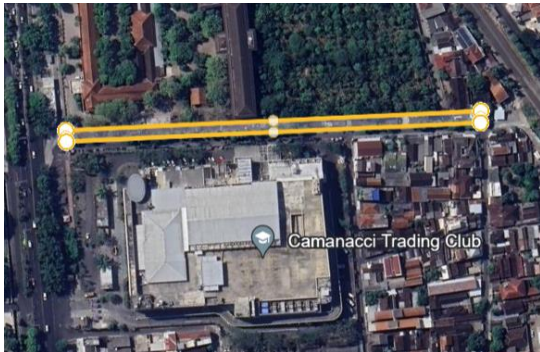
Gambar 12. Lokasi Shelter Kuliner Solo Square

Shelter Kuliner Solo Square berada di sebelah Timur Solo Square Mall, lebih tepatnya di Jl. Slamet Riyadi, Pajang, Kec. Laweyan, Kota Surakarta. Shelter ini menjual berbagai variasi makanan dengan luas \pm 2.100 m 2 . Shelter ini bisa dikatakan berhasil dan hidup karena selalu ramai oleh pedagang maupun pengunjung. Untuk mengetahui perbedaan antara shelter sekaligus dapat digunakan sebagai bahan pembandingan maka dilakukan studi banding ke Shelter Kuliner Solo Square.