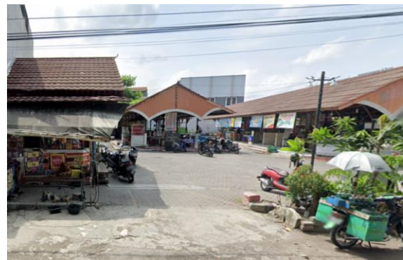
Gambar 3. Pintu Masuk

Sumber acuan yang digunakan adalah Peraturan Menteri Pariwisata No 28 Tahun 2015 tentang Standar Usaha Pusat Penjualan Makanan. Berikut ini identifikasi fasilitas yang ada di Shelter Kuliner Mojosongo: