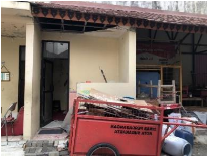
Gambar 4. Mushola