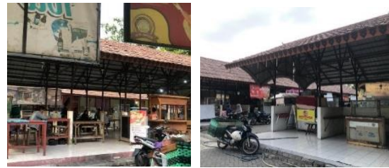
Gambar 2. Gerai dengan pembatas (kiri) dan gerai tanpa pembatas (kanan)

antar gerai sehingga terkesan lebih longgar yang dapat di lihat pada gambar 2.