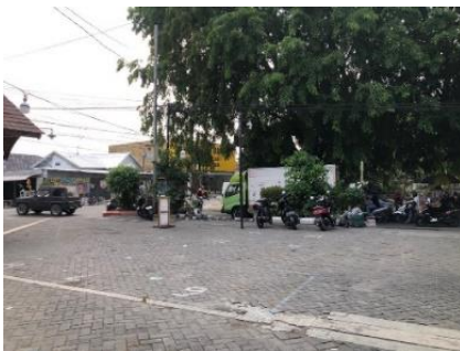
Gambar 6. Parkir