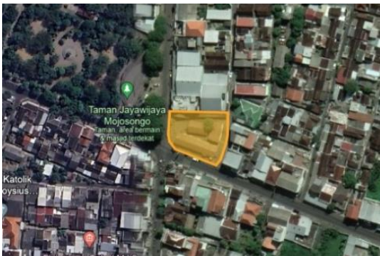
Gambar 1. Lokasi Shelter Kuliner Mojosongo

Shelter Kuliner Mojosongo berada di samping Taman Jayawijaya, lebih tepatnya di Jl. Tangkuban Perahu No.78, Mojosongo, Jebres, Surakarta. Shelter ini tergolong strategis karena berada di samping perempatan dengan kondisi lalu lintas yang padat dan dekat dengan pemukiman penduduk. Namun, meskipun lokasi shelter tergolong strategis, intensitas pengunjung dan pedagang yang datang ke shelter tergolong rendah.