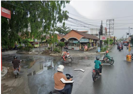
Gambar 11. Akses keluar di Perempatan

Akses keluar mayoritas dilakukan melalui jalan B, namun jalan B langsung terhubung dengan perempatan yang memiliki kondisi lalu lintas sangat padat, hal tersebut dirasa kurang efektif karena dapat mengganggu lalu lintas di sekitarnya. Gambar 11 menunjukkan akses keluar yang berada di perempatan, hal tersebut merupakan salah satu kesalahan dalam mendesain.