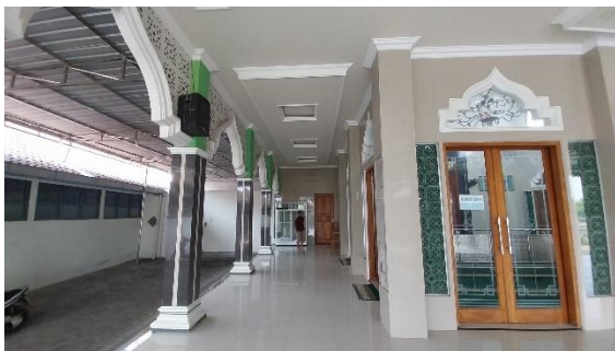
Gambar 10. Serambi Masjid Jami' Baitul Makmur

Masjid Jami' Baitul Makmur didesain baru menyesuaikan kebutuhan dan pengalaman penggunaannya berdasarkan evaluasi dari desain sebelumnya. Elemen visual seperti kaligrafi dan pola-pola geometri Islami ditempatkan pada area yang dapat dilihat.