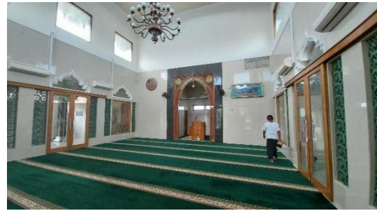
Gambar 13. Ruang Sholat

buatan berupa lampu yang dapat memperindah interior dan eksterior masjid.