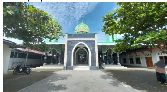
Gambar 14. Tampak Depan Masjid

Masjid Jami' Baitul Makmur belum menunjukkan hubungan dengan alam. Masjid ini memiliki halaman yang luas, namun elemen alami seperti taman masih kurang dan belum ada elemen air. Hal itu menunjukkan masih kurangnya desain lingkungan yang dapat menggambarkan perasaan rasa syukur terhadap ciptaan Allah.