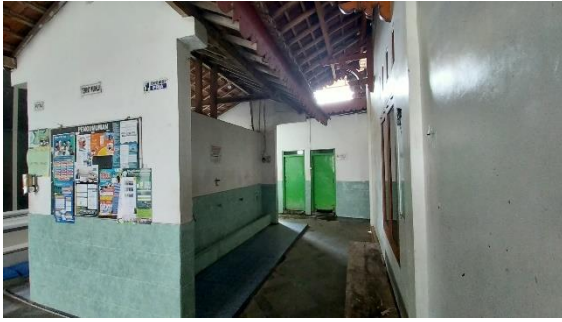
Gambar 12. Tempat Wudhu dan Toilet