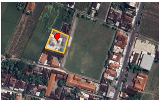
Gambar 1. Lokasi Masjid Jami' Baitul Makmur

Masjid Jami' Baitul Makmur ini berlokasi di Bembem Rt 01/RW 02, Desa Gentan, Kecamatan Bendosari, Kabupaten Sukoharjo, Provinsi Jawa Tengah. Masjid ini dibangun pada tahun 1982, kemudian pada tahun 2014 dibangun ulang dengan desain baru. Di dalam lahan masjid terdapat beberapa bangunan antara lain bangunan utama (area sholat + serambi), tempat wudhu, toilet, ruang marbot, dan Gedung IPHI Gentan.