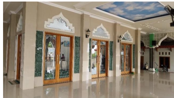
Gambar 7. Serambi Masjid Jami' Baitul Makmur

Masjid Jami' Baitul Makmur dirancang dengan desain modern kontemporer yang dihiasi dengan bentuk-bentuk geometri Islam. Bentuk geometris Islam dapat dilihat pada bentuk roster yang ada di dinding. Masjid ini memiliki ruang yang fleksibel dan multifungsi serta terdapat area terbuka yang cukup luas.