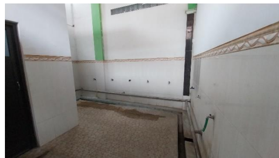
Gambar 11. Tempat Wudhu dan Toilet Wanita

Masjid ini memanfaatkan pencahayaan alami melalui bukaan yang lebar dan skylight, sehingga dapat mengurangi kelembapan yang memicu pertumbuhan jamur, lumut dan bakteri untuk menciptakan lingkungan yang sehat dan nyaman bagi jamaah. Namun, belum memanfaatkan penghawaan alami secara maksimal karena bukaan-bukaan ditutupi oleh kaca agar udara AC tidak bocor keluar. Masjid ini menyediakan fasilitas kebersihan seperti tempat wudhu, toilet, dan tempat sampah. Namun, hal tersebut belum maksimal. Area wudhu dan toilet terlihat kotor karena terlihat kerak yang menempel pada keramik dan besi.