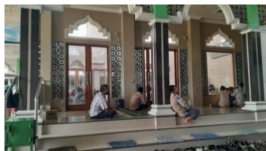
Gambar 3. Kegiatan di Masjid Jami' Baitul Makmur (Sumber: Dokumen Penulis, 2024)

Secara Hablum Minannas , masjid ini menyediakan fasilitas yang dapat mendukung interaksi antarindividu maupun komunitas. Berbagai kegiatan positif masyarakat dalam berbagai bidang seperti pendidikan, sosial, dan budaya berupa kegiatan pengajian, tpa, program berbagi atau sedekah, dan kegiatan lainnya dapat dilakukan di area masjid, yaitu pada bangunan utama bagian dalam, serambi atau selasar, halaman, serta dapat dilakukan di Gedung IPHI samping masjid.