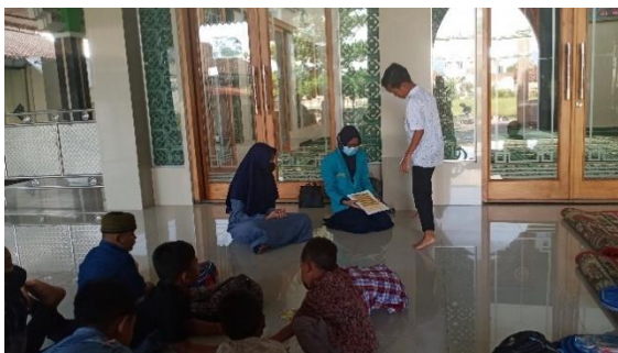
Gambar 6. Kegiatan TPA di Masjid Jami' Baitul Makmur

Filosofi Bermanfaat (Tidak Mudhorot) memiliki makna bahwa lingkungan binaan yang dirancang harus dapat bermanfaat dan fungsional.