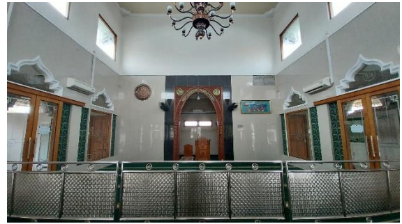
Gambar 9. Ruang Sholat Masjid Jami' Baitul Makmur

wanita menggunakan pembatas yang berbahan stainless .