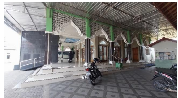
Gambar 5. Area Bagian Utara Masjid Jami' Baitul Makmur

Masjid Jami' Baitul Makmur ini mendukung kebutuhan masyarakat dengan penyediaan ruang yang dapat digunakan untuk berbagai kegiatan, termasuk kegiatan spiritual atau ibadah. Terdapat ruang ibadah yang nyaman dan fleksibel, serambi yang luas, toilet, dan tempat wudhu yang dapat mendukung kegiatan jamaah.