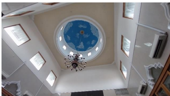
Gambar 4. Skylight Masjid Jami' Baitul Makmur

Namun, masjid ini belum memaksimalkan dalam pemanfaatan penghawaan alami karena seluruh bukaan pada area sholat tertutup oleh kaca, sehingga penghawaan alami tidak dapat maksimal. Oleh karena itu, masjid ini menggunakan penghawaan buatan seperti kipas dan AC.