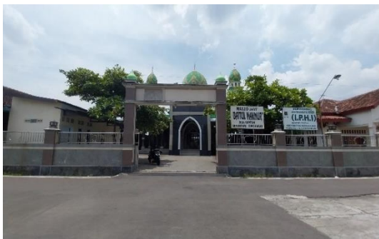
Gambar 2. Tampak Depan Masjid Jami' Baitul Makmur

Masjid Jami' Baitul Makmur ini sering digunakan masyarakat sekitar untuk berbagai kegiatan seperti kegiatan ibadah, kegiatan pendidikan dan kegiatan sosial. Desain masjid ini terkesan modern, dengan hiasan ornamen geometris Islam.