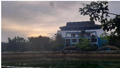
Gambar 1. DPK Tangerang Selatan Dan Taman Kolam Maruga

Dalam tahap pertama penelitian yaitu menganalisis kondisi fisik lapangan, terutama kawasan lanskap perpustakaan dan taman kolam untuk ditinjau lebih lanjut dan dipelajari setiap aspek fisik dan fungsi tentang pengaruhnya terhadap pengguna.