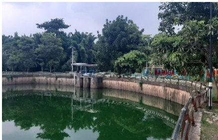
Gambar 9. DAM kolam