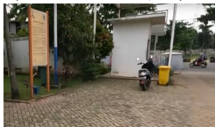
Gambar 6. Pos satpam