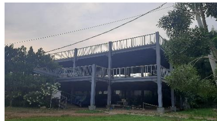
Gambar 5. Gedung parkir