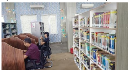
Gambar 10. Interior perpustakaan