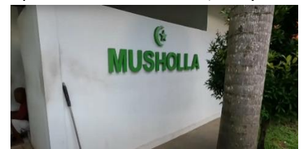
Gambar 7. Mushola