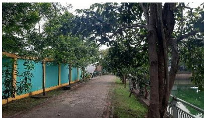
Gambar 10. Jogging track