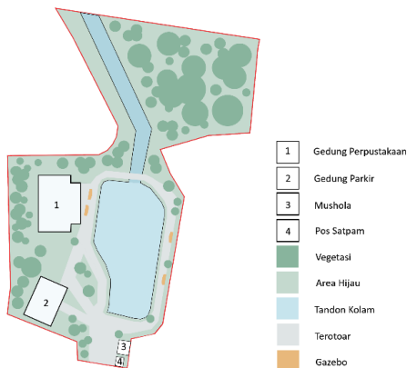
Bagan 2. Bagan Kondisi Eksisting