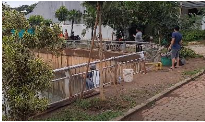
Gambar 8. Kegiatan memancing warga di taman kolam