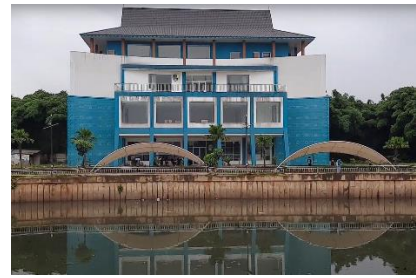
Gambar 2. Gedung DPK Tangerang Selatan Dan Taman Kolam Maruga