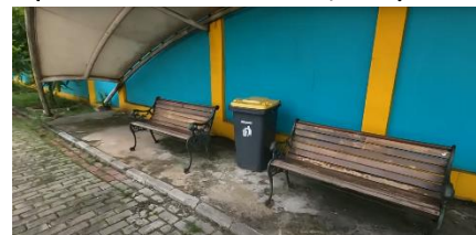
Gambar 4. Gazebo