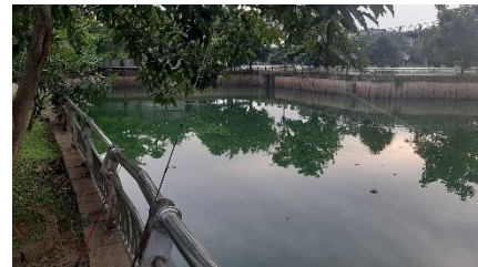
Gambar 3. Taman Kolam