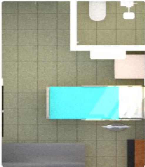
Gambar 4. Desain Denah Ruang Rawat Inap Pracimantoro

Ukuran ruang rawat inap yang diambil sebagai sampel adalah 3,5m x 5m dengan ketinggian mencapai 3,5m dan sebuah jendela yang menghadap selatan dengan ukuran 1,3m x 2m.