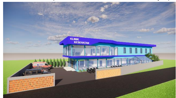
Gambar 2. 3D Modelling Perencanaan Klinik Pracimantoro