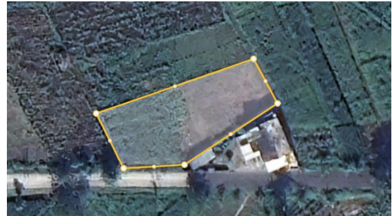
Gambar 1. Lokasi Site (Google Earth Pro, 2024) Pracimantoro (sumber: CV. Batik Mahkota Laweyan)

Penelitian ini dilakukan di desain klinik kesehatan Pracimantoro Wonogiri yang berada di Jl. Pracimantoro Kab. Wonogiri, Jawa Tengah, 57664.