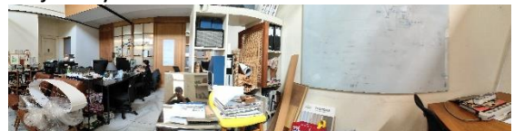
Gambar 1. Suasana Kantor Lama SASO Area Belakang

Kantor SASO Architecture berencana untuk pindah ke kantor baru yang akan dibangun di sebelah kantor lama. Dikarenakan kondisi kantor lama yang didesain sebagai rumah tinggal dan dijadikan sebagai kantor, maka kantor yang lama terasa kurang nyaman, sempit, pencahayaan kurang dan penghawaan yang terlalu mengandalkan AC berpotensi memengaruhi kenyamanan dan produktivitas kerja karyawan.