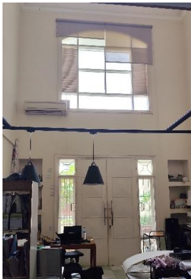
Gambar 3. Bukaan Kantor Lama SASO

Selama masa magang di Kantor SASO, dilakukan riset kecil untuk mengamati kondisi lingkungan kerja dan pengaruhnya terhadap produktivitas karyawan. Hasil observasi menunjukkan pencahayaan dan penghawaan di ruang kerja cenderung tinggi di pagi hari, berkisar antara 600-650 lux dan suhu sekitar 29°, namun makin kecil di sore hari pencahayaan di area belakang sekitar 400 lux dengan suhu 30°. Ini disebabkan karena hanya ada 1 sisi bukaan pada area pintu masuk.