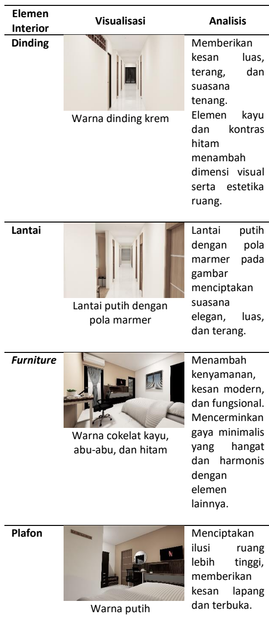
Tabel 3. Analisis Interior Warna Kos Muntilan