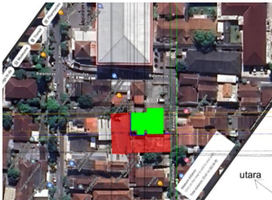
Gambar 1. Site Lokasi Kos Muntilan (sumber: Google Maps, 2024)

Melalui Penelitian ini, diharapkan dapat diperoleh wawasan yang lebih mendalam mengenai bagaimana peran tekstur dan warna material dalam menciptakan desain interior kos yang harmonis dan menarik. Penelitian ini juga diharapkan dapat memberikan kontribusi terhadap perkembangan dalam mendesain interior kos ekonomis di Muntilan, Magelang, serta menjadi referensi bagi pemilik kos dan desainer interior yang ingin menciptakan hunian kos yang tidak hanya terjangkau, tetapi juga memiliki estetika dan kenyamanan yang optimal bagi penghuni.