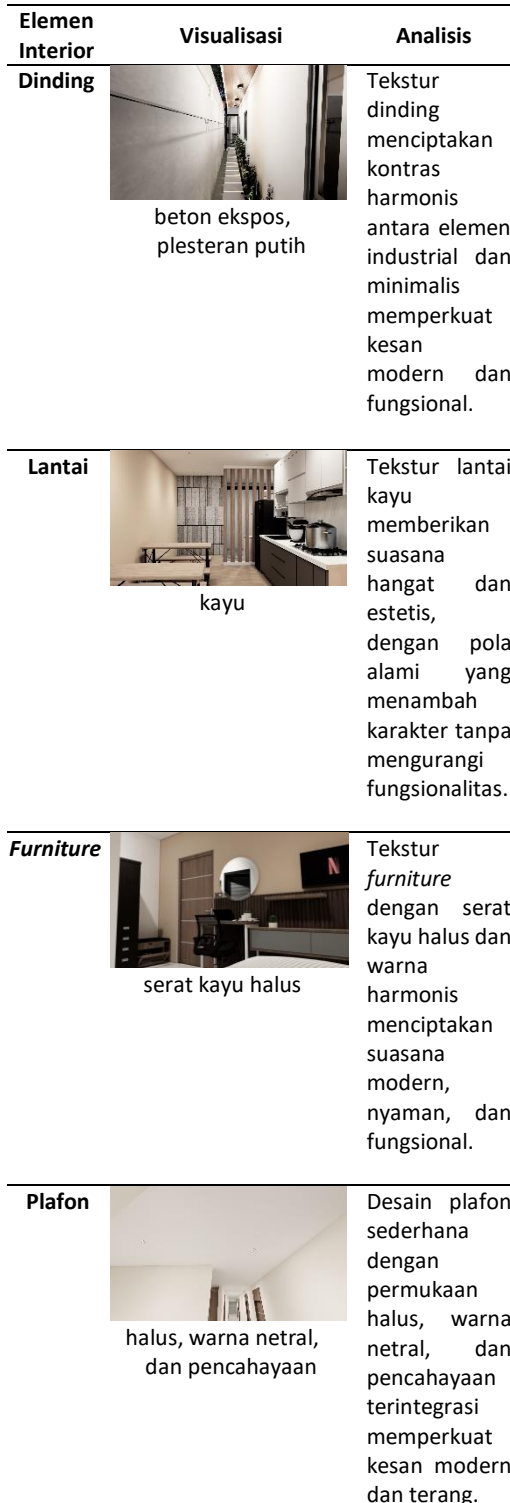
Tabel 4. Analisis Interior Tekstur Kos Muntilan