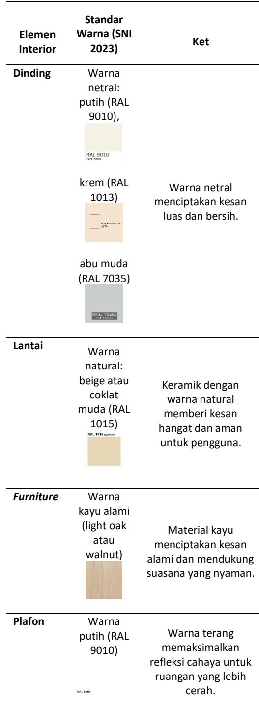
Tabel 4. Analisis Standar Warna