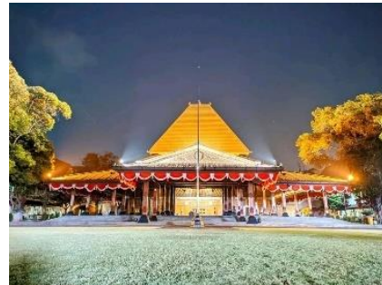
Gambar 1. Pendapa Gedhe