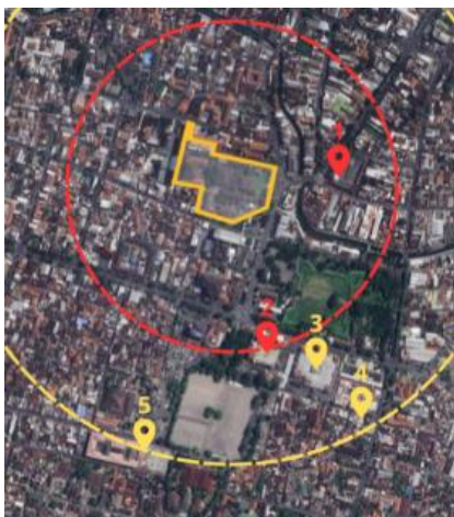
Gambar 10. Pusat Ekonomi