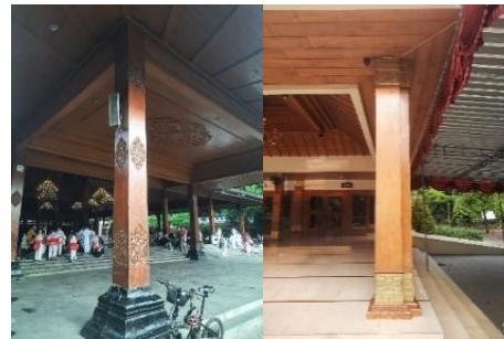
Gambar 7. Tiang Pendapa (Kanan) dan Masjid (Kiri)

Ukiran-ukiran dapat dilihat pada tiang-tiang pendapa Gede dan masjid Baitul Makmur, ukiran menggunakan motif-motif tanaman pada coraknya