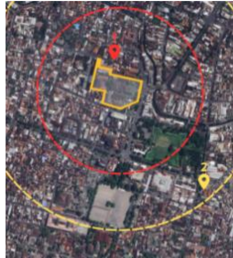
Gambar 11. Fasilitas Pendidikan