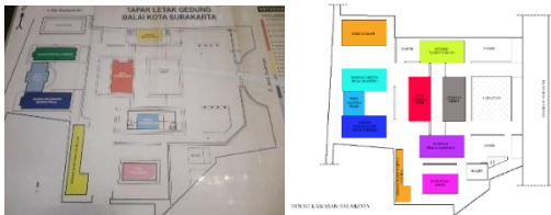
Gambar 5. Denah Kawasan

Denah kawasan Balaikota memiliki kemiripan dengan denah rumah tradisional Jawa. Pendapa sebagai ruang public berada didepan kawasan kemudian diikuti Bale Tawang Arum sebagai pusat kawasan dan kantor Bupati yang dikelilingi beberapa gedung sebagai pendukung Bale Tawang Arum untuk menjalankan fungsi utamanya sebagai pusat administrasi wilayah kota.