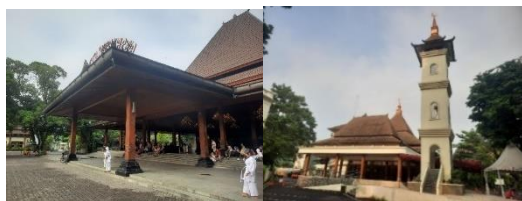
Gambar 6. Pendapa Gedhe (Kanan) dan Masjid Baitul Makmur (Kiri)

Bangunan-bangunan yang ada pada kawasan banyak dipengaruhi oleh arsitektur Jawa. Hal ini terlihat pada bangunan Pendapa Gede, sebuah bangunan yang sarat akan budaya Jawa dengan atap besar bentuk joglo dan tiang-tiang besar di bawahnya berhasil menjadikan Pendapa Gede ikon Balaikota Surakarta dan menggambarkan bagaimana masyarakat dan pemerintah Surakarta menghargai serta menjaga warisan-warisan budaya mereka. Elemen-elemen arsitektur Jawa juga terlihat pada bangunan lainnya seperti Masjid Baitul Makmur yang memiliki atap bertingkat mirip dengan masjid Agung Demak yang merupakan salah satu masjid tertua.