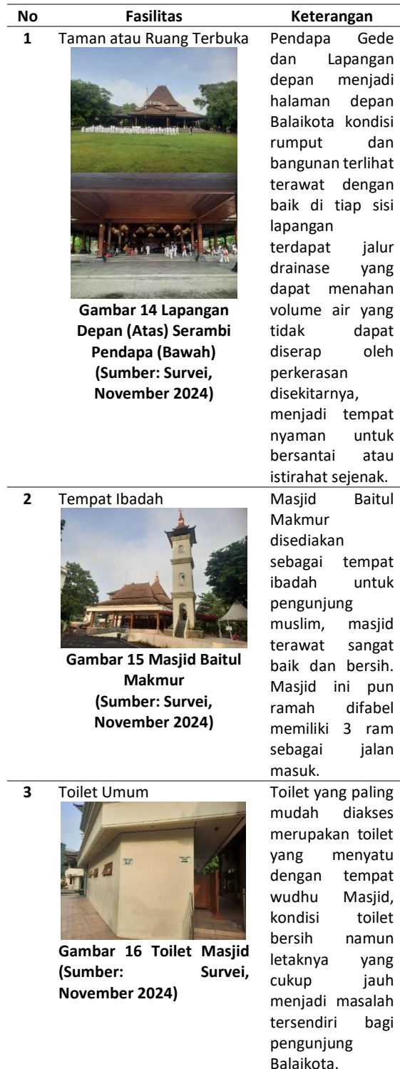
Tabel 3. Fasilitas di Balaikota Surakarta

kebutuhan dasar pengunjunnya seperti keberadaan toilet, tempat ibadah, taman hijau, dll. berikut fasilitas-fasilitas yang ada pada Balaikota Surakarta :