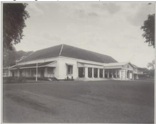
Gambar 2. Balaikota Masa Kolonial

Daerah Surakarta sebelum kemerdekaan Indonesia tahun 1945 merupakan wilayah Vorstenlanden atau swapraja, Wilayah yang memiliki status tersebut berhak untuk memerintah atau mengatur rumah tangganya sendiri tanpa ada campur tangan pihak luar mirip seperti status daerah keistimewaan pada masa pra-kemerdekaan. Status Vorstenlanden diatur dalam kontrak yang dibentuk langsung antara Gubernur kolonial dengan Raja Setempat (Sri Sunan). Terdapat dua jenis kontrak yang terbentuk pada masa ini, kontrak pertama merupakan kontrak panjang yang menyatakan tentang kesetaraan kekuasaan antara pihak kolonial dengan keraton Surakarta yang membuat keraton terikat sepenuhnya dengan kekuasaan Belanda, dan kontrak kedua merupakan pernyataan pendek berisi tentang pengakuan keraton terhadap kekuasaan Belanda. Kasunanan Surakarta diatur oleh kontrak panjang sedangkan Makunegaran diatur dalam pernyataan pendek. Kontrak-kontrak ini diperbarui oleh Belanda setiap pergantian kepemimpinan Kasunanan dan Mangkunegaran (ANRI, 2014).