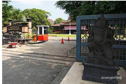
Gambar 3 Balaikota Pasca Kemerdekaan

Sejak pembangunannya pada masa kolonial, gedung Balaikota telah banyak melewati masa-masa kritis dalam perjalanan bangsa Indonesia mencapai kemerdekaannya, gedung asli warisan Belanda sempat bertahan sampai terjadinya pembakaran oleh massa pada peristiwa kerusuhan 1998 seperti terjadi pada saat Clash II tahun 1948 oleh Belanda (Qomarun dan Prayitno, 2007).