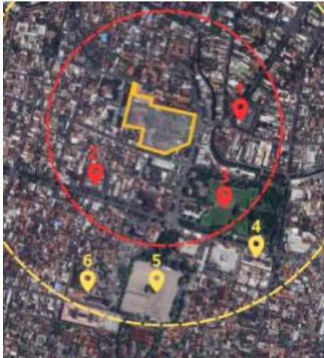
Gambar 9. Peta Landmark