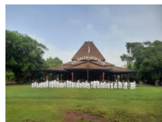
Gambar 4. Lapangan dan Pendapa Gedhe

Ruang publik yang terbangun dapat mewakili bagaimana gambaran masyarakat atau komunitas sekitarnya. Elemen-elemen yang mewakili biasanya diambil dari budaya setempat dan bentuk pengaplikasian elemen-elemen ini beragam. Pada ruang publik yang diteliti terdapat beberapa elemen budaya lokal