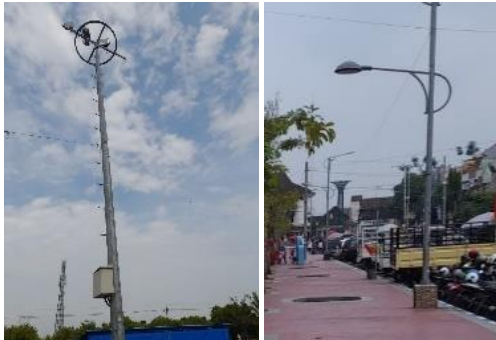
Gambar 13 Lampu Penerangan

Terdapat beberapa tipe penerangan pada alun-alun. Pada tipe 1 lampu sangat tinggi ditempatkan pada sudut alun-alun dan bagian tengah. Pada tipe 2 digunakan pada jalur pedestrian. Tipe 3 digunakan sebagai lampu hias taman. Kondisinya baik.