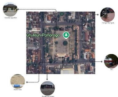
Gambar 16 sebelum penataan fasilitas

memenuhi kebutuhan masyarakat dan menciptakan interaksi sosial yang positif yaitu, penataan fasilitas pada alun-alun Ponorogo harus mempertimbangkan aspek estetika dan fungsi seperti pembagian zonasi pada alun-alun sehingga dapat mempermudah aktivitas yang berlangsung, menyediakan area khusus untuk pedagang kaki lima demi menjaga kenyamanan pengunjung serta kebersihan alun-alun, melibatkan masyarakat dalam program kebersihan untuk menjaga kebersihan di alun-alun dan menambah jumlah tempat sampah, menciptakan area parkir yang ditujukan bagi pengunjung alun-alun agar tidak mengganggu lalu lintas, serta memperhatikan pemeliharaan untuk fasilitas-fasilitas yang ada di alun-alun Ponorogo.