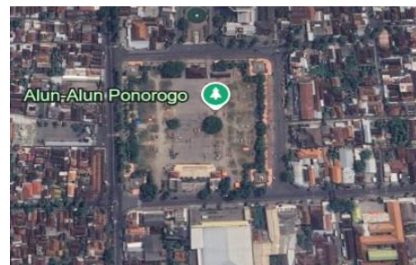
Gambar 2. lokasi alun-alun Ponorogo

Alun-Alun Ponorogo terletak di pusat kota Ponorogo, Kabupaten Ponorogo, Jawa Timur. Lokasinya yang strategis menjadikannya pusat aktivitas sosial, budaya, dan ekonomi masyarakat Ponorogo. Sebagai ruang publik utama, alun-alun ini dikelilingi oleh bangunan penting yang memperkuat fungsinya sebagai pusat kota.