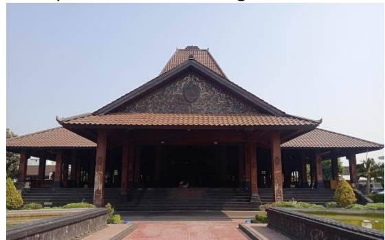
Gambar 10 pendopo agung Ponorogo

Beberapa bangunan yang berada di alun-alun Ponorogo dipelihara dengan baik oleh pemerintah seperti pendopo agung, masjid agung Ponorogo. Sehingga menghindarkan di kawasan alun-alun Ponorogo dari pengalihan bentuk dan fungsi karena aspek kemersial untuk pemerintahan Ponorogo.