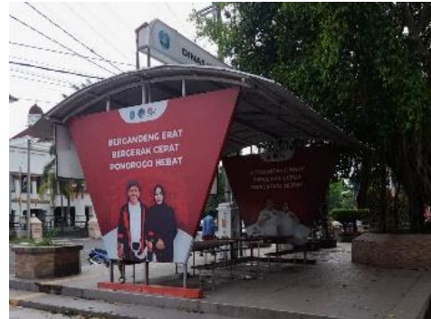
Gambar 15 Fasilitas Wifi Umum

jangkauan hanya terbatas sehingga pengunjung yang membutuhkan wifi harus berada pada jangkauan tertentu.