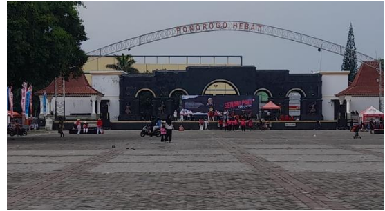
Gambar 9 kegiatan pendukung yang ada di alun-alun Ponorogo (sumber: Dokumen Penulis, 2025)