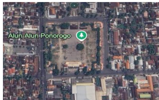
Gambar 1. lokasi Alun-Alun Ponorogo

nilai historis dan budaya, namun juga menjadi simbol identitas kota serta sarana rekreasi dan aktivitas sosial.