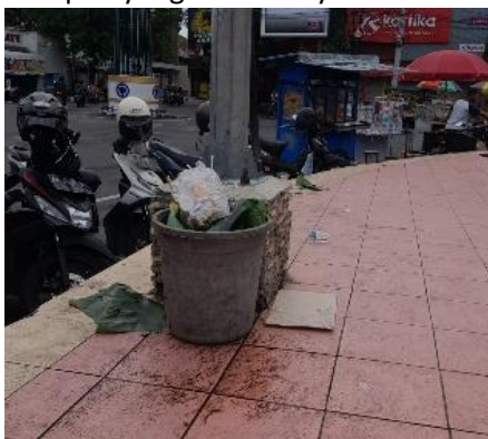
Gambar 14 Fasilitas Kebersihan

Tempat sampah yang tersedia masih kurang sehingga banyak pengunjung yang membuang sampah sembarangan, sehingga diperlukan tempat sampah yang lebih banyak.