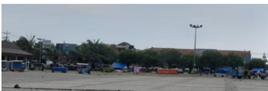
Gambar 8 kondisi PKL di alun-alun Ponorogo

Untuk mendukung kegiatan pada alun-alun Ponorogo terdapat pedagang kaki lima (PKL) yang berada dipinggir alun-alun, namun penataan PKL yang kurang tepat menjadikan alun-alun kurang nyaman dipandang. Saat hari minggu biasa digunakan warga untuk jogging pagi atau hanya berjalan santai, dan juga beberapa acara lain, saat memasuki bulan suro alun-alun biasa difungsikan sebagai wadah kegiatan festival budaya dan banyak kegiatan lainnya.