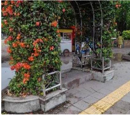
Gambar 12 Sitting grup Alun-Alun Ponorogo (sumber: Dokumen Penulis, 2025)