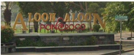
Gambar 7 penanda dikawasan alun-alun Ponorogo

Untuk menuju alun-alun Ponorogo terdapat papan jalan dan nama dari alun-alun Ponorogo yang dapat terlihat dari jalan utama, sehingga pengunjung dapat dengan mudah menuju lokasi.