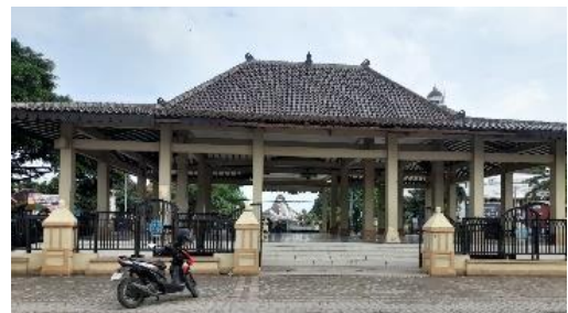
Gambar 11 Akses Masuk Alun-Alun Ponorogo

Memiliki akses masuk dari berbagai sudut namun saat acara tertentu akses masuk dari sebelah utara.