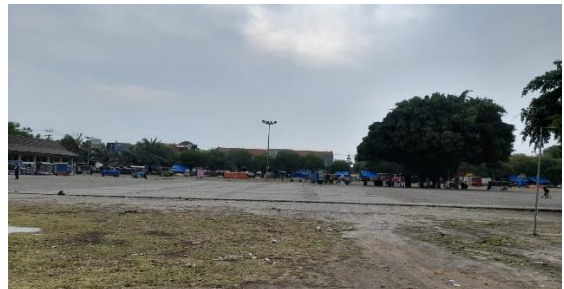
Gambar 5 ruang terbuka pada alun-alun Ponorogo

Sebagai area publik, alun-alun Ponorogo memiliki luas yang cukup besar. Namun, sayangnya meskipun ruang terbuka ini cukup luas, jumlah pepohonan yang ada sangat minim, sehingga hanya dapat memberikan perlindungan di area trotoar saat cuaca panas.