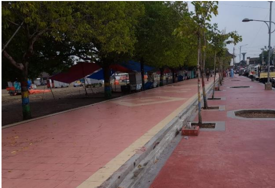
Gambar 6 jalur pedestrian pada alun-alun Ponorogo

pepohonan, lampu jalan, tempat sampah, tempat duduk