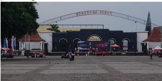
Gambar 3 suasana alun-alun Ponorogo

Alun-alun Ponorogo sering dimanfaatkan untuk berbagai kegiatan, seperti upacara bendera pada tanggal 17 Agustus, sebagai lokasi pameran, untuk acara keagamaan, untuk acara budaya, untuk sarana olahraga pada hari minggu pagi, serta untuk tempat berkumpul para warga.