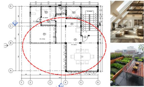
Gambar 4. Fleksibilitas Desain Denah lantai 2 & 3