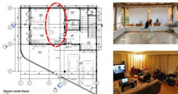
Gambar 3. Fleksibilitas Desain Denah lantai dasar

Konsep adaptabilitas ruang terhadap waktu diimplementasikan melalui desain denah cair ( Fluid layout ). Analisis fleksibilitas ruang pada Denah Lantai 1 hingga Lantai 4 menunjukkan bagaimana satu unit hunian dapat mengakomodasi varian aktivitas yang berbeda.