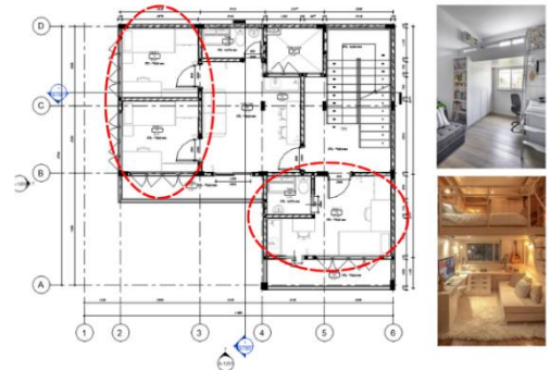
Gambar 5. Fleksibilitas Desain Denah lantai 4

Desain ini tidak menggunakan partisi kaku (dinding masif) secara berlebihan. pembagian ruang sangat bergantung pada variabel waktu penggunaan. Varian desain ini memastikan bahwa meskipun luasan unit terbatas, kualitas spasial tetap terjaga karena ruang mampu beradaptasi mengikuti siklus hidup penghuninya.