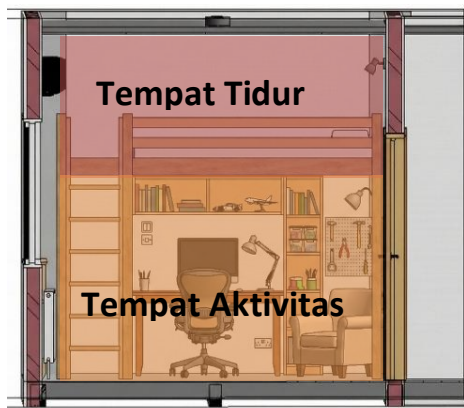
Gambar 6. Penerapan Loft Bed