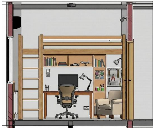
Gambar 2. Perabot modular dalam bentuk loft bed

Efisiensi Ruang dan Konstruksi: Dengan dimensi yang telah terstandarisasi, modul ini dipabrikasi di luar lokasi ( off-site ) untuk menjamin presisi ukuran sehingga meminimalkan durasi pengerjaan di lapangan dan mengurangi limbah konstruksi.