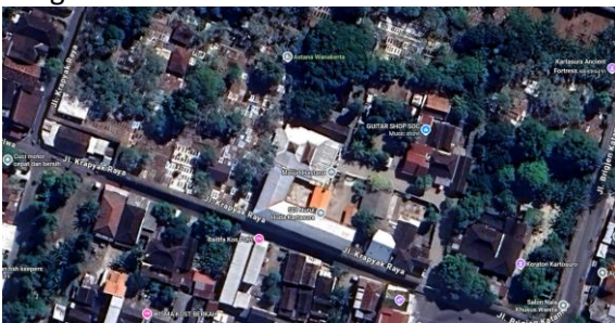
Gambar 2. Lokasi Masjid Keraton Hastana Kartasura.

Layaknya situs warisan budaya lain, masjid di Hastana Kartasura menjadi fokus kajian karena kesetiiaannya terhadap ciri bangunan masa lalu. Wilayah penelitiannya sendiri mencakup area ibadah tersebut, tepatnya di wilayah administratif Kecamatan Kartasura, bagian dari kabupaten Sukoharjo, Provinsi Jawa Tengah.