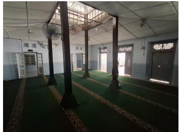
Gambar 4. Ruang Utama Masjid Hastana Kastasura dengan empat saka guru.

Meskipun sering dihindari dalam percakapan, kematian justru mengajak manusia merenung tentang hubungan dengan Allah SWT., Dalam wujud bangunan, masjid menyatu padukan kearifan lokal Jawa dan ajaran Islam lewat bentuk atap bersusun tiga, tiang utama berjumlah empat, lalu ornamen bercorak tanaman serta pola ukir matematis yang sarat arti.