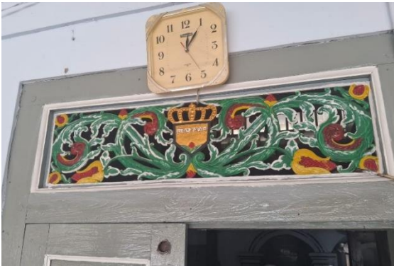
Gambar 6. Ornamen flora bermotif mahkota emas pada pintu utama.

desain masjid di Jawa yang menggunakan elemen alam guna menunjukkan wujud ketuhanan.