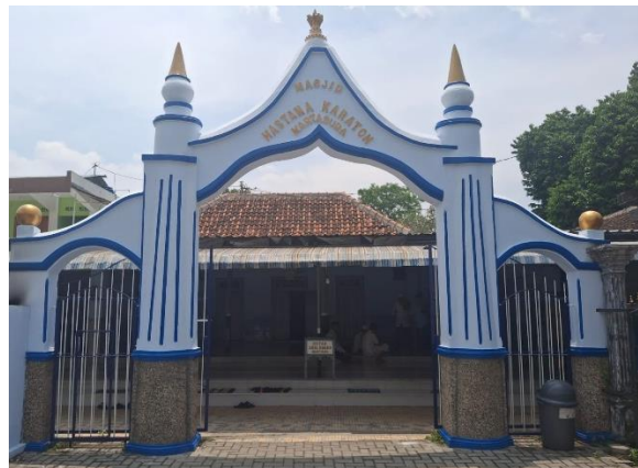
Gambar 8. Tampak depan gapura utama Masjid Hastana Kartasura.

Pada ruang mihrab kelihatan sebuah mimbar dari kayu, rekaannya tradisional dengan hujung melengkung di bahagian puncak. Tempat ini digunakan untuk menyampaikan khutbah oleh imam setiap Jumaat. Kayunya yang tidak dicat menyerlahkan warna semula jadi, begitu juga bentuknya yang ringkas menggambarkan sikap sederhana sesuai ajaran agama. Dari temubual bersama pentadbir masjid, diketahui struktur itu telah wujud sejak pertama kali bangunan ini didirikan. Keberadaannya turut menjadi tanda bahawa peranan utama masjid dalam penyebaran ilmu tetap diteruskan hingga hari ini.