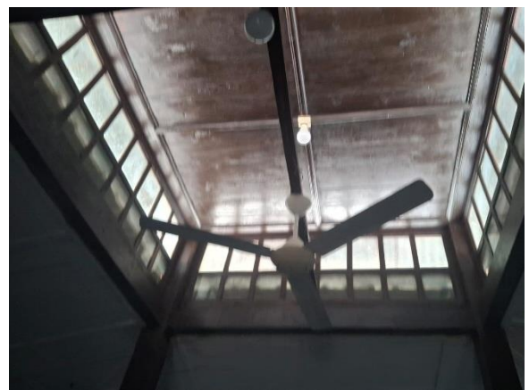
Gambar 5. Ventilasi diatas saka guru, simbol cahaya ilahi (Nur ilahi).

Di tengah masjid berdiri empat pilar besar terbuat dari kayu jati, simbol dari empat sahabat Nabi Muhammad SAW, yang juga menahan atap dengan susunan tiga tingkat. Atap berundak itu merepresentasikan tahapan rohani manusia: iman, Islam, dan ihsan, serta proses mencapai kematangan keyakinan. Berdasarkan wawancara, para pilar belum pernah diganti sejak pertama kali dibangun; satu-satunya pemeliharaan adalah lapisan baru agar tetap bertahan lama..