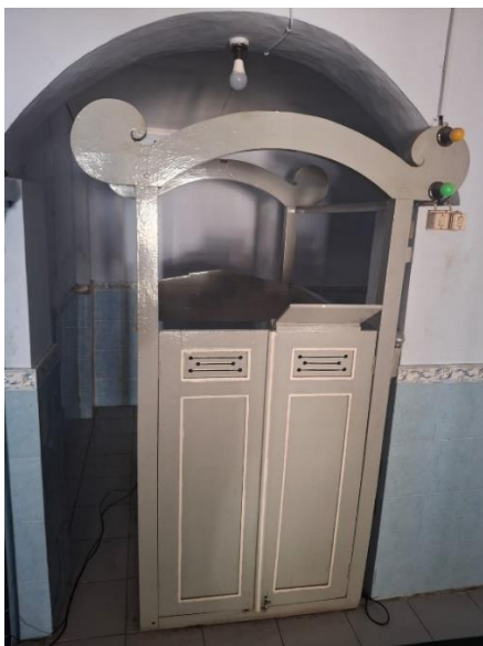
Gambar 7. Mimbar kayu tradisional Masjid Hastana Kartasura.

Di bagian dinding serta pintu masuk, terdapat ornamen berupa ukiran tumbuhan - seperti daun, bunga, sampai bentuk mahkota. Tak sekadar indah dipandang, ornamen alam itu menyiratkan arti lebih dalam; bunga mewakili anugerah hidup dari Yang Mahakuasa, sementara mahkota emas merujuk pada keluhuran dan wibawa ilahi. Susunan tiap polanya bersifat seimbang, mencerminkan keserasian antara realitas fisik dengan rohani. Dengan garis-garis halus, ukiran ini justru membawa nuansa tenang khas tradisi Islam-Jawa yang sarat makna batin.