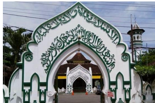
Gambar 1. Gerbang Masjid Al-Wustho .

Pentingnya ornamen dalam arsitektur Jawa tak lepas dari gagasan sangkan paraning dumadi - soal awal dan akhir kehidupan manusia. Menurut Widodo tahun 2018, ornamen di masjid-masjid tradisional Jawa mencerminkan paduan antara ajaran Islam dengan nilai-nilai setempat yang mendalam. Gaya desain seperti parang, kawung, maupun lung-lungan digunakan bukan sekadar dekoratif, tetapi mengandung makna perjalanan batin serta keselarasan alam semesta, sebagaimana ditegaskan Haryanto (2021).