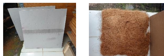
Gambar 3. Panel Gypsum dan Sabut Kelapa

Untuk membuktikan sejauh mana kemampuan sabut kelapa dalam menyerap kebisingan, diperlukan pembuatan mock up dinding partisi yang menggabungkan panel gypsum dengan lapisan sabut kelapa sebagai material pengisi atau lapisan tambahan. Mock up ini dirancang menyerupai sistem dinding partisi yang akan diterapkan pada renovasi kantor.