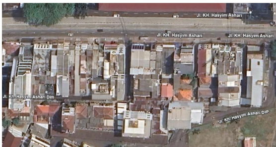
Gambar 2. Lokasi Site

Pemilihan objek ini didasarkan pada kebutuhan akan fleksibilitas ruang, efisiensi biaya renovasi, serta peningkatan kenyamanan akustik ruang kerja.