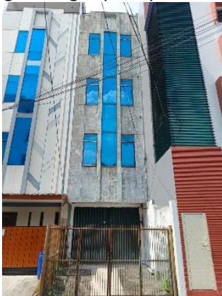
Gambar 1. Kantor Konsultan Struktur

Kantor konsultan struktur di Jakarta beroperasi dalam lingkungan bisnis yang dinamis dan kompetitif, dengan tantangan yang dihadapi berupa biaya renovasi yang tinggi dan keterbatasan lahan. Kondisi ini menuntut solusi desain yang tidak hanya efisien dan hemat biaya, tetapi juga berkelanjutan. Permasalahan utama yang dihadapi pada renovasi konvensional seringkali berupa tata ruang yang kaku, sirkulasi yang tidak optimal, serta tingginya limbah material dari dinding bata yang dibongkar. Pendekatan konvensional ini terbukti boros dan bertentangan dengan prinsip keberlanjutan.