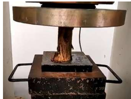
Gambar 2. Pengujian kuat tekan kayu alam dengan kulit

Sedangkan kayu galam tanpa kulit dengan diameter 2.8 cm, 3.8 cm dan 4.15 cm menghasilkan kuat tekan sebesar 38.35 MPa, 31.67 MPa dan 21.20 MPa