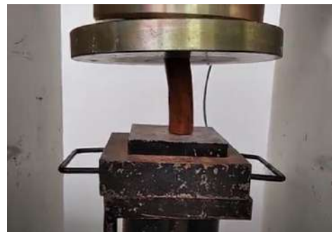
Gambar 3. Pengujian kuat tekan kayu Galam tanpa kulit