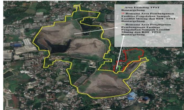
Gambar 1. Peta rencana lokasi pembangunan fasilitas pengolahan sampah

Selanjutnya, studi ini akan melakukan kajian berdasarkan literatur yang membahas “konstruksi berkelanjutan” yang menjadi bahan validator penerapan konstruksi pada proyek studi kasus dan menjadi landasan dalam memberikan rekomendasi terhadap Permen PUPR No 09 Tahun 2021 terkait kriteria yang perlu dipertimbangan dalam penerapan konstruksi berkelanjutan.